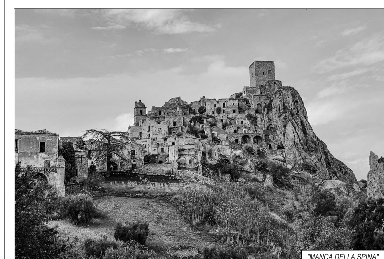
"MANCA DELLA SPINA"

• Studio sul patrimonio storico costruito non tutelato, (masserie, opere d'arte del paesaggio rurale storico, muretti a secco, etc.) presente nell'area vasta nel rispetto dei buffer previsti dalla normativa nazionale e regionale di riferimento, anche su cartografia nella quale il patrimonio dovrà essere opportunamente numerato e completo di denominazione;