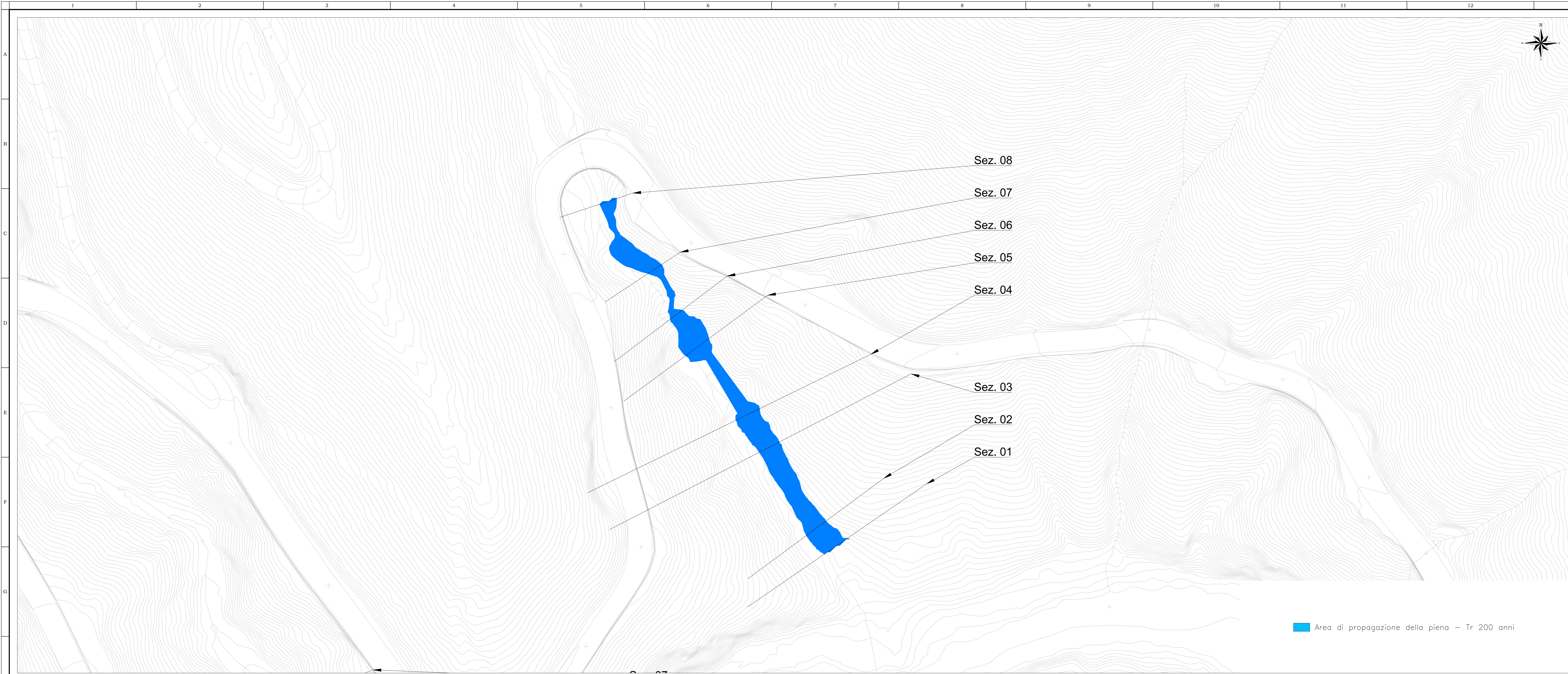
Area di propagazione della piena - Tr 200 anni