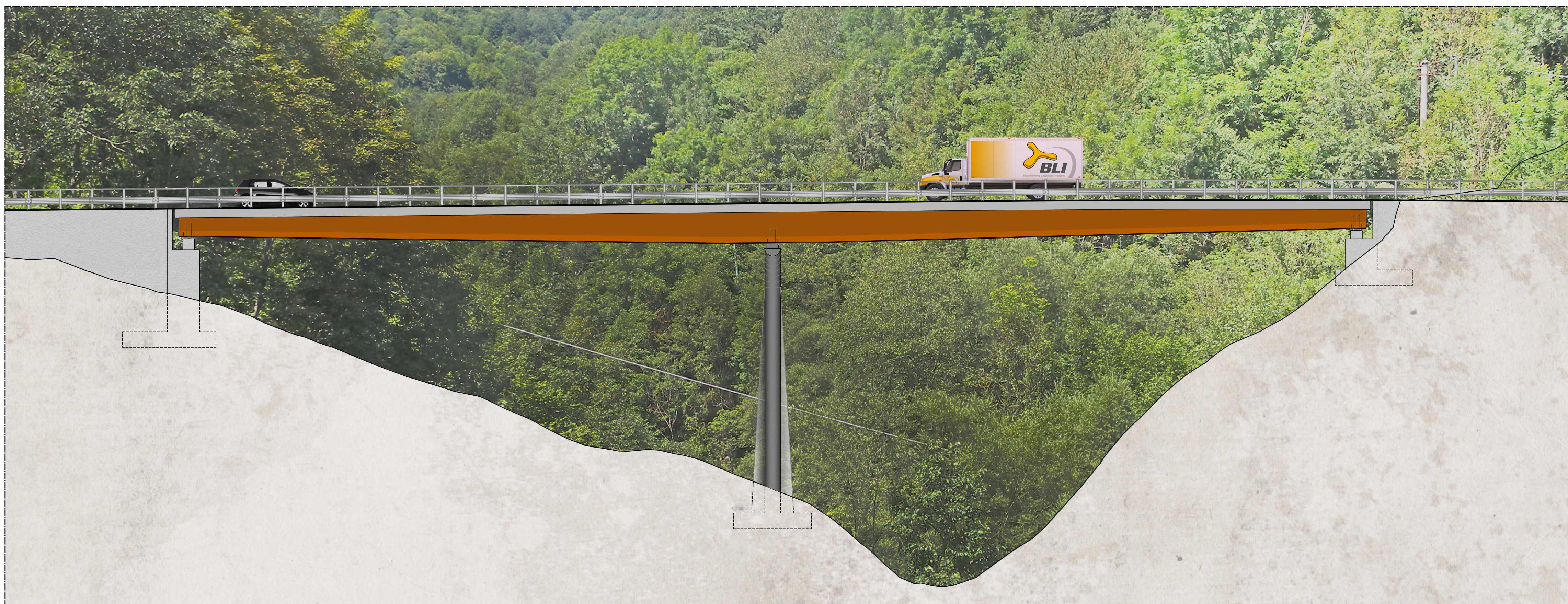
PROSPETTO VI01 da km 0+455 a km 0+545 scala 1:200