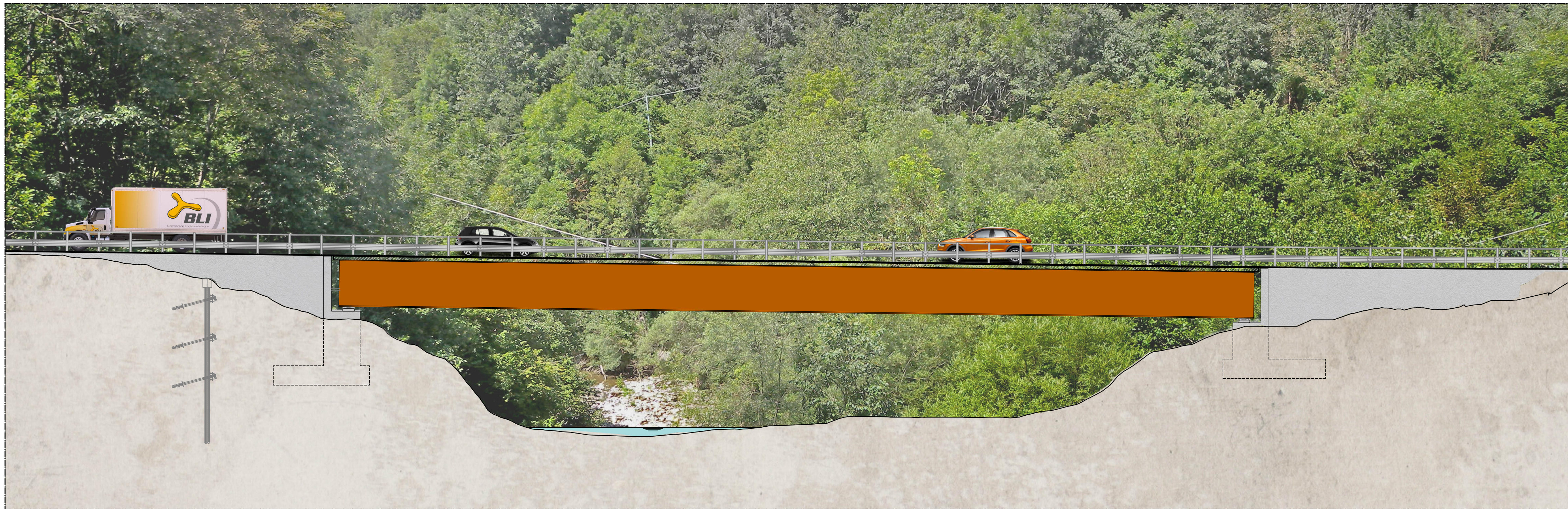
PROSPETTO PONTE SUL TREBBIA da km 0+000 a km 0+174 scala 1:200