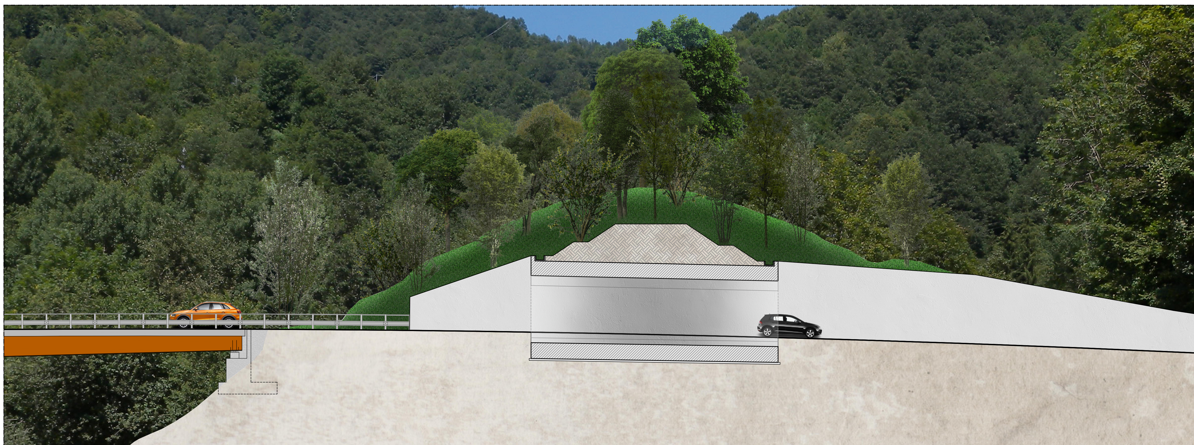
SEZIONE SULLA GALLERIA da km 0+590 a km 0+615 scala 1:200