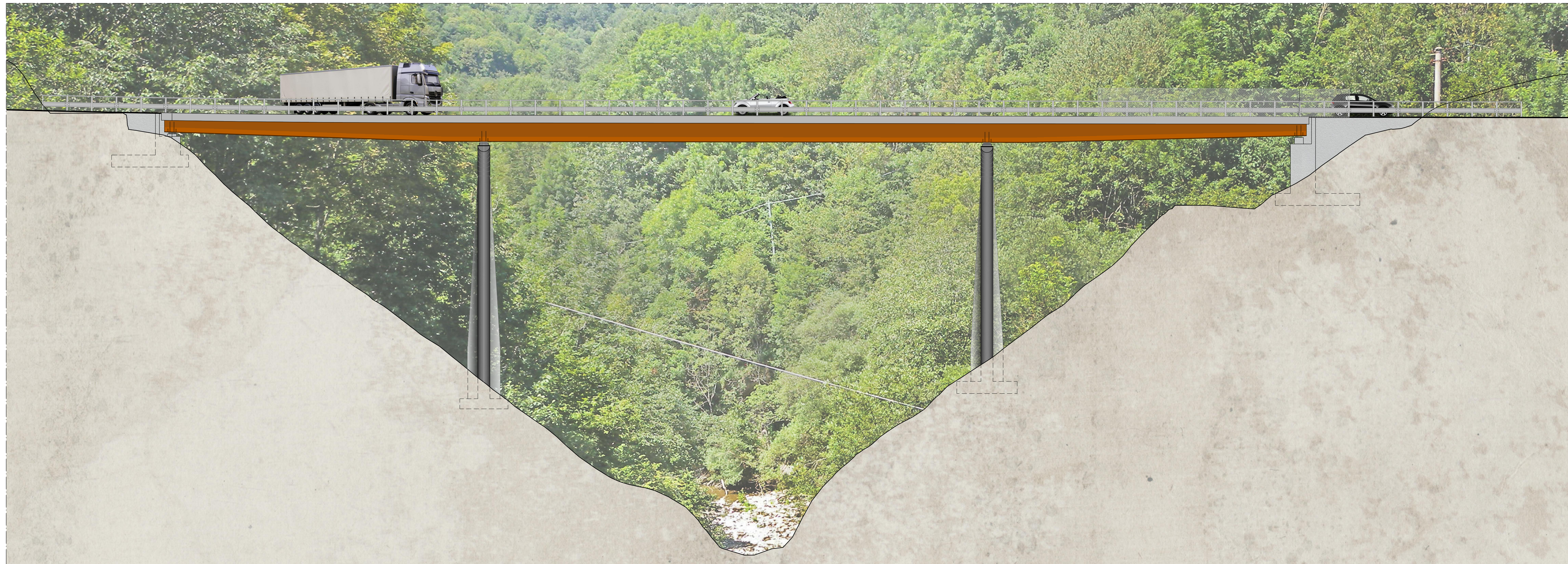
PROSPETTO V103 da km 1+377.92 a km 1+489.92 scala 1:200