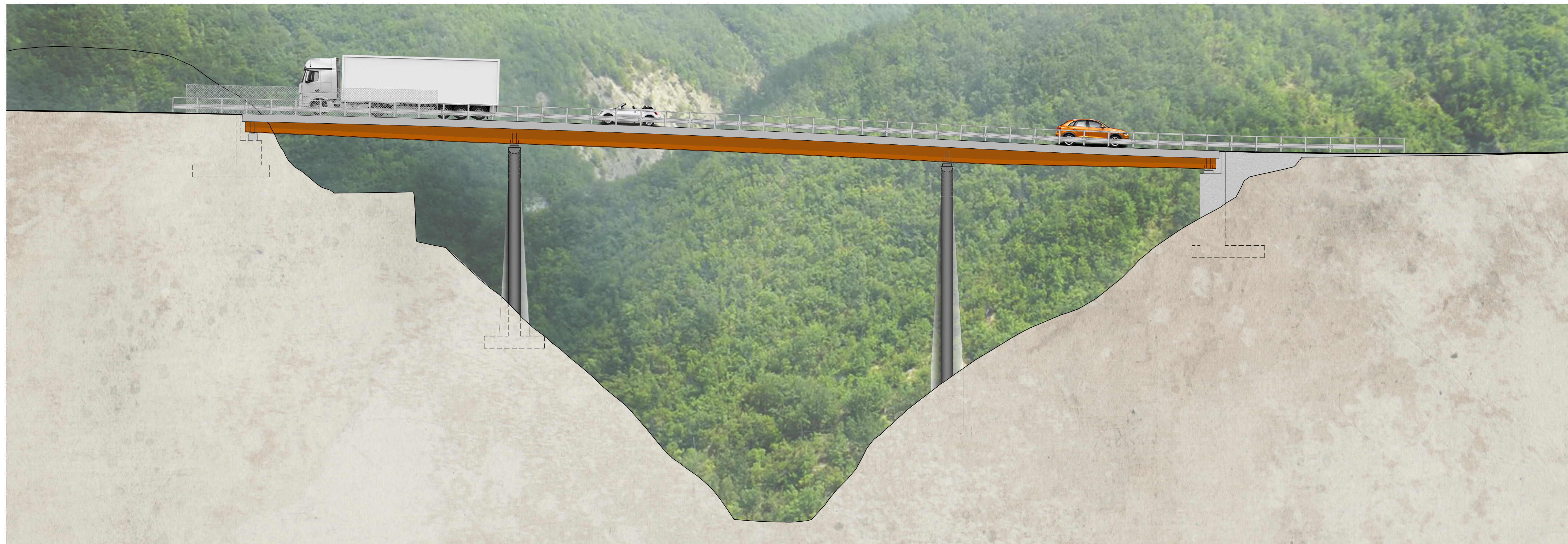
PROSPETTO V104 da km 1+561.52 a km 1+656.52 scala 1:200