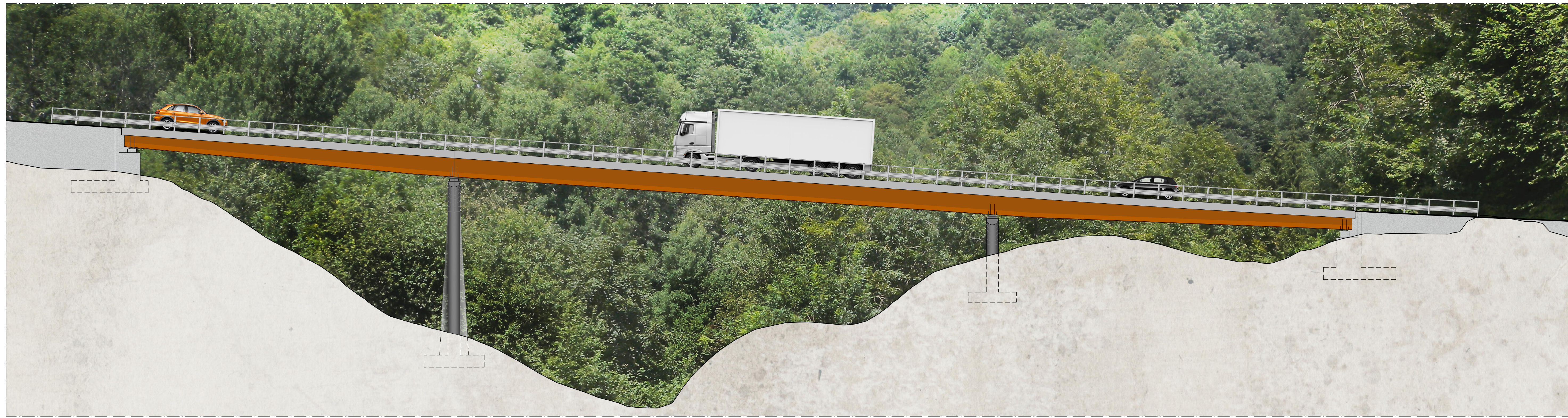
PROSPETTO VIADOTTO V102 da km 1+013 a km 1+133.50 scala 1:200