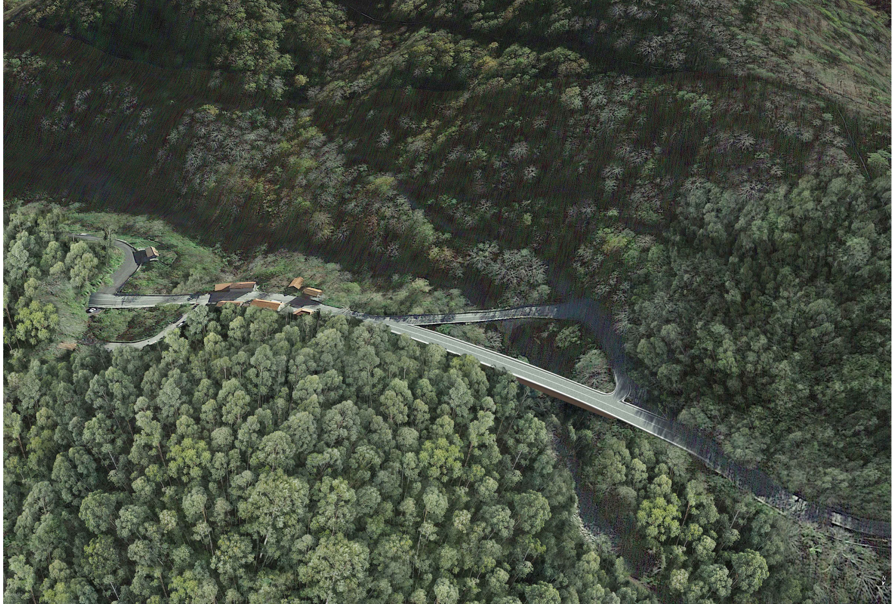
01 - POST OPERAM - Vista a volo d'uccello da NE verso SO