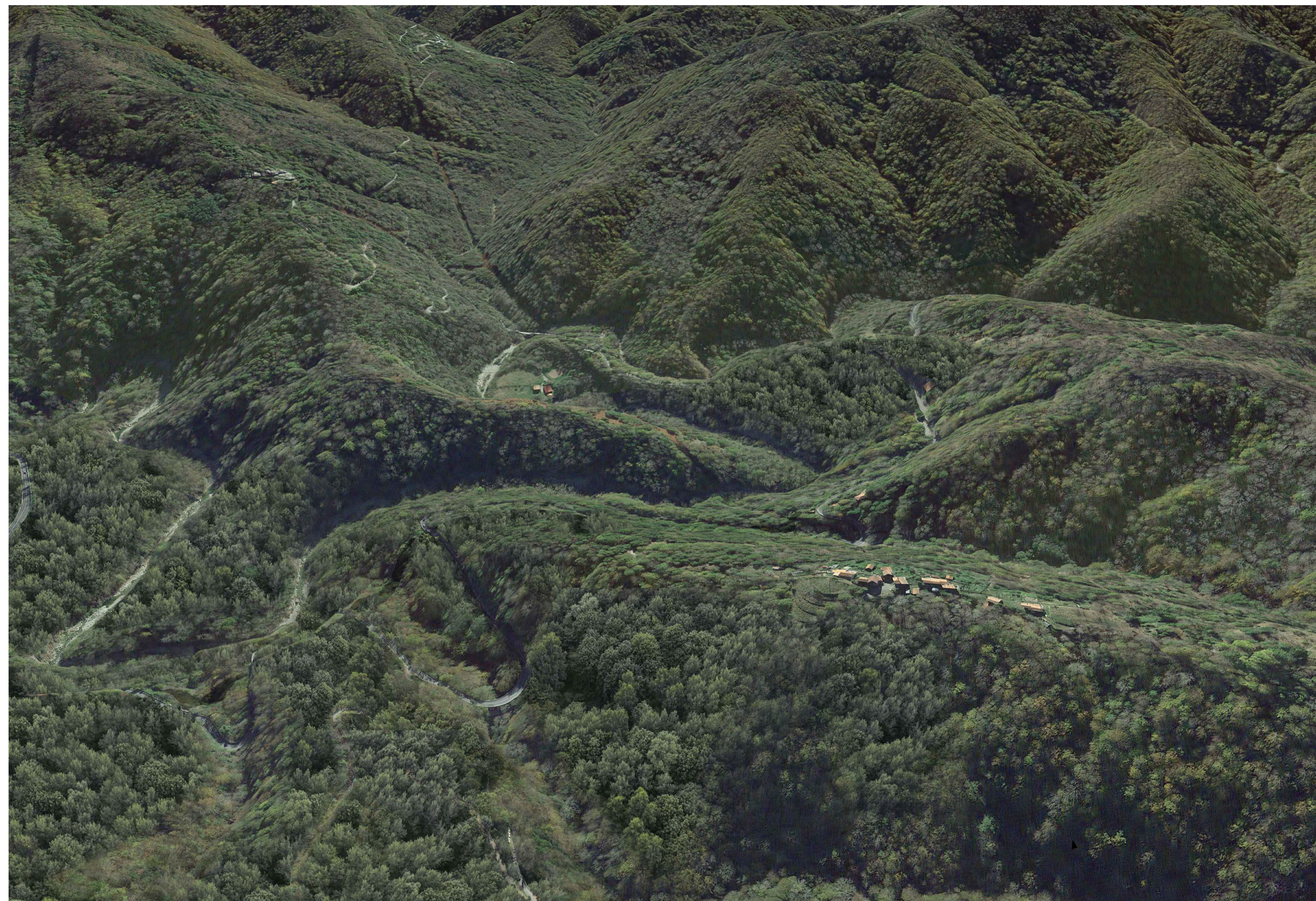
03 - ANTE OPERAM - Vista a volo d'uccello da SO verso NE