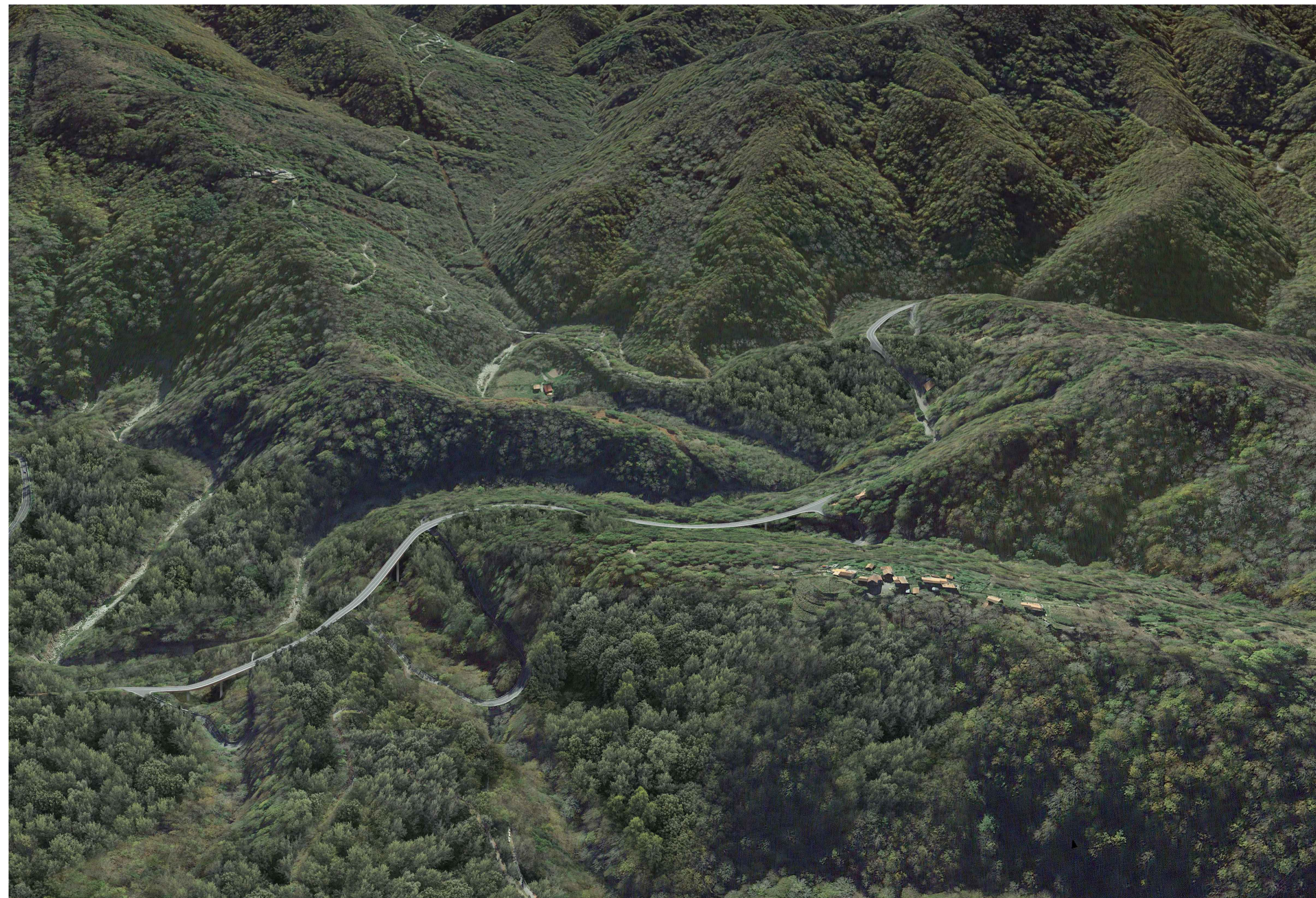
03 - POST OPERAM - Vista a volo d'uccello da SO verso NE