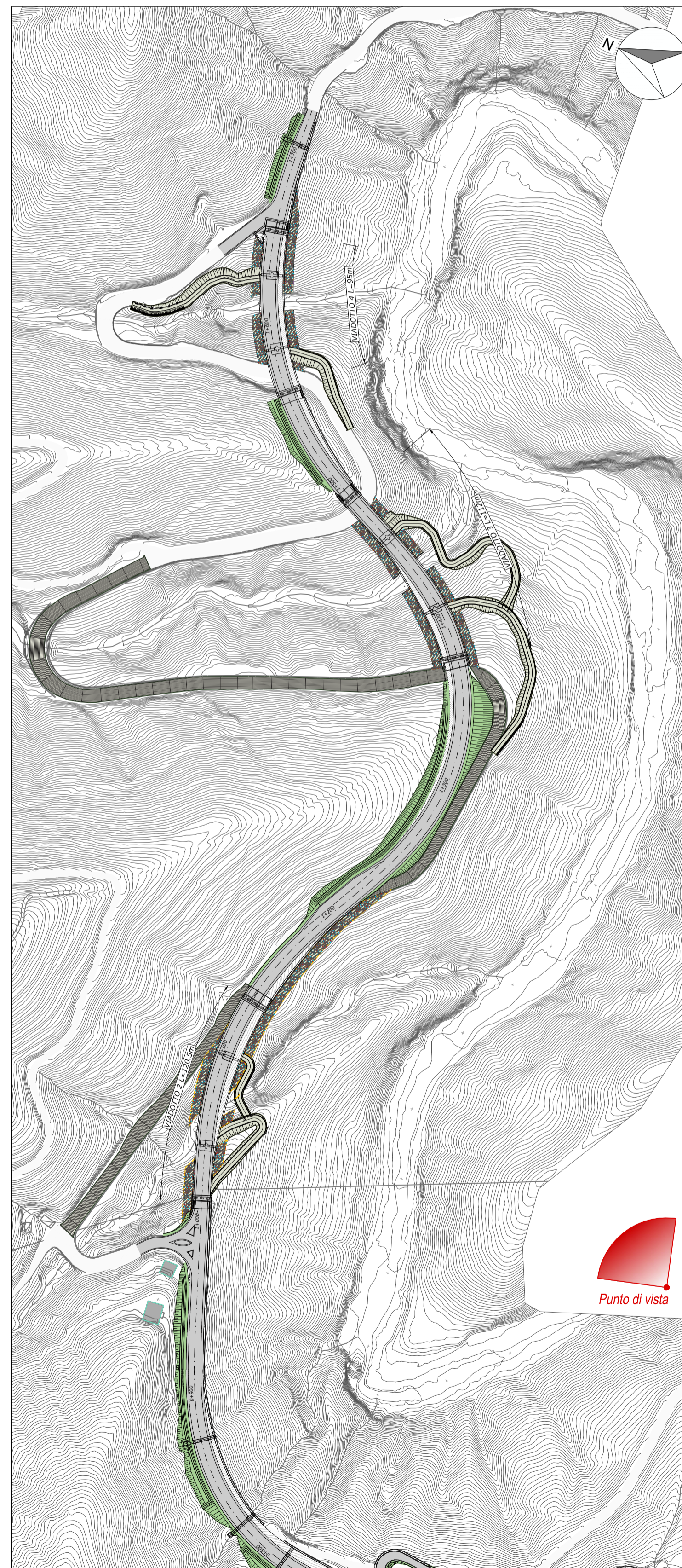
PROGETTO DI MITIGAZIONE AMBIENTALE (elaborato TOOAI01AMBPP01A)