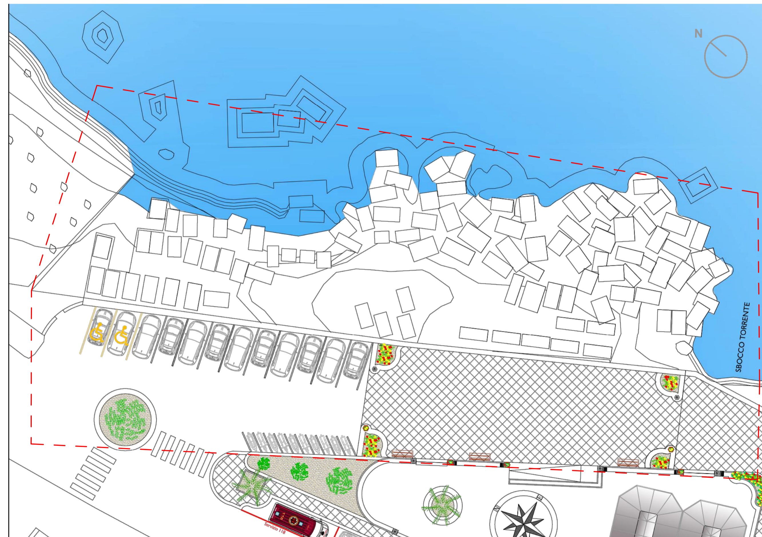
Planimetria generale dello Stato di fatto - Scala 1:200