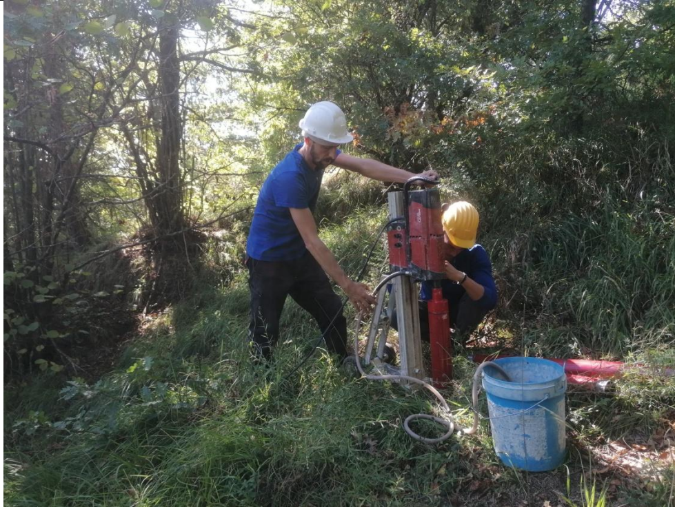
Esecuzione carotaggio P. 108