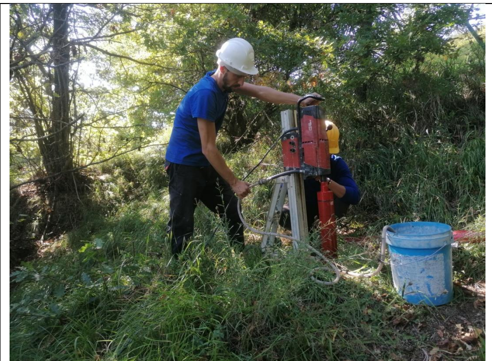
Esecuzione carotaggio P. 108