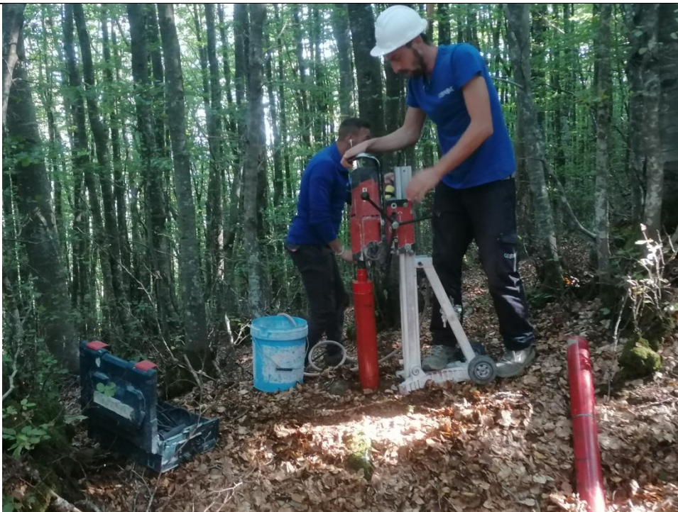
Esecuzione carotaggio P. 110