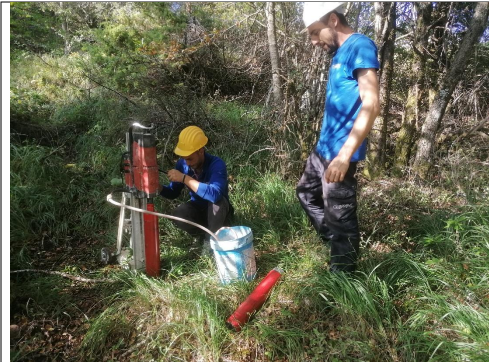
Esecuzione carotaggio P. 114