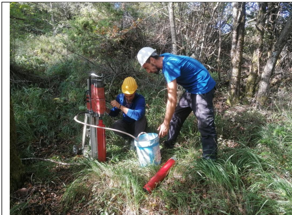
Esecuzione carotaggio P. 114