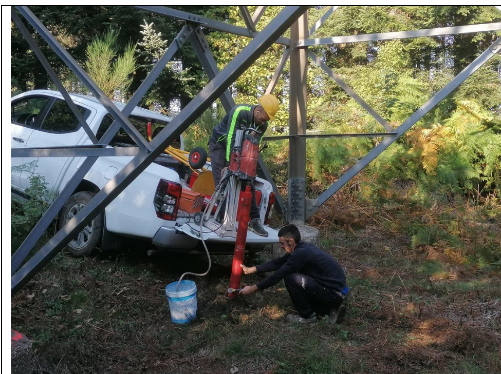
Esecuzione carotaggio P. 126