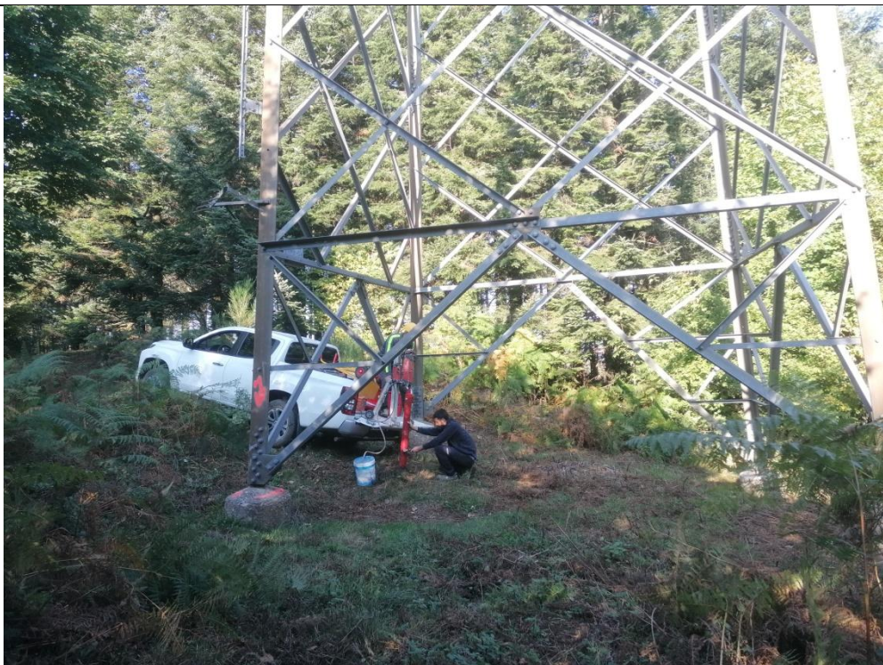
Esecuzione carotaggio P. 126