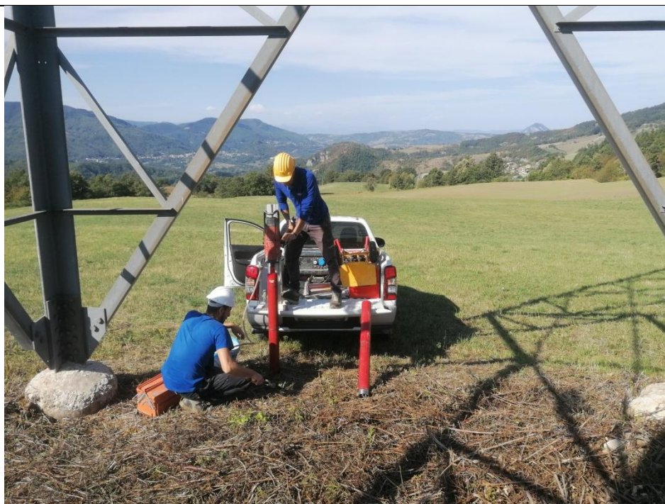
Esecuzione carotaggio P. 132