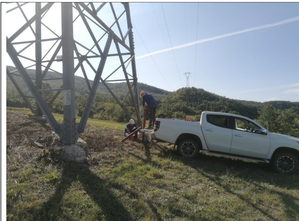
Esecuzione carotaggio P. 132