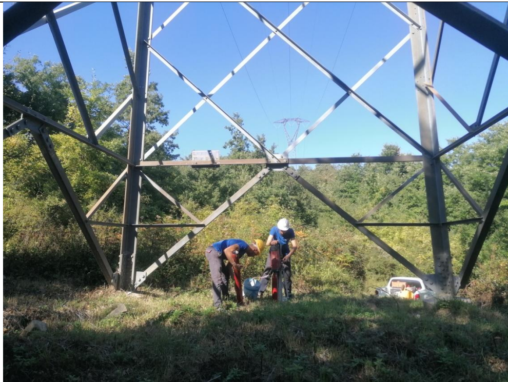
Esecuzione carotaggio P. 143