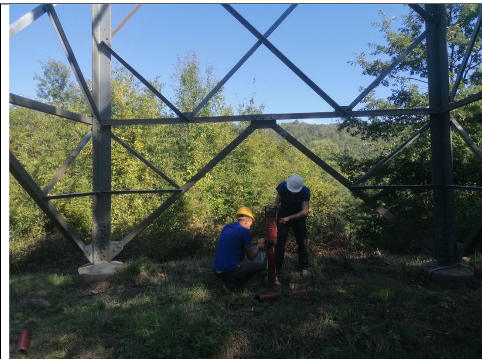
Esecuzione carotaggio P. 143