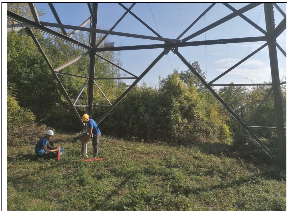
Esecuzione carotaggio P. 147