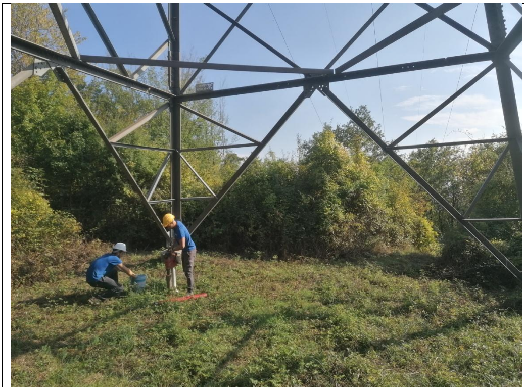
Esecuzione carotaggio P. 147