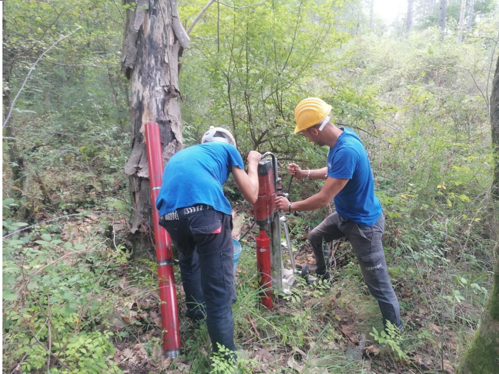
Esecuzione carotaggio P. 152