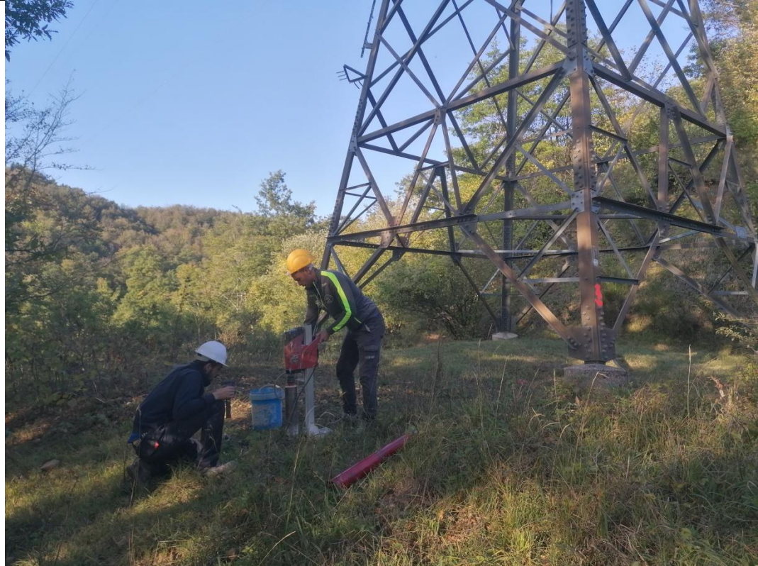
Esecuzione carotaggio P. 153