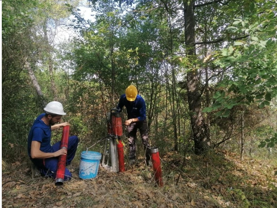
Esecuzione carotaggio P. 170