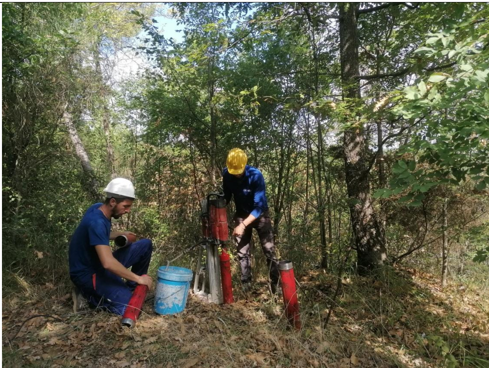
Esecuzione carotaggio P. 170