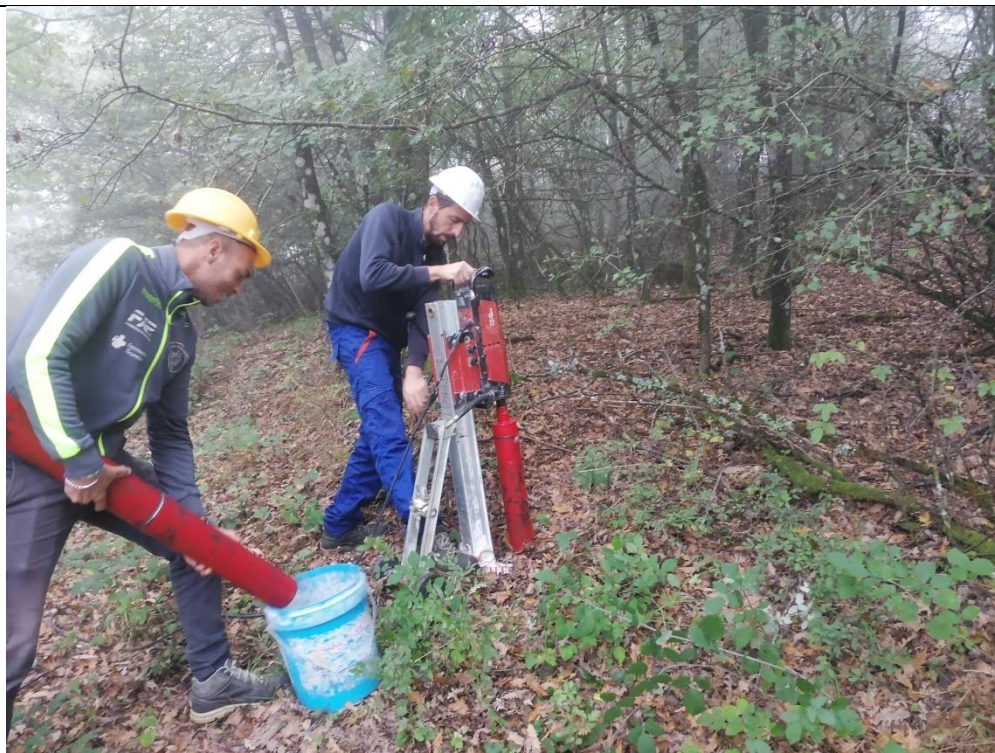
Esecuzione carotaggio P. 2H