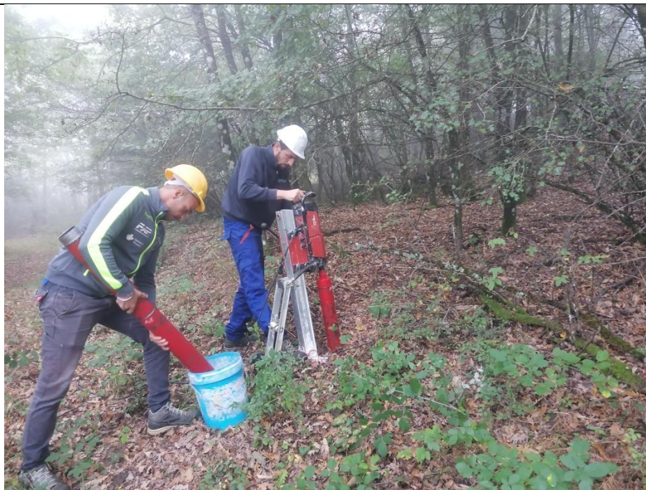
Esecuzione carotaggio P. 2H