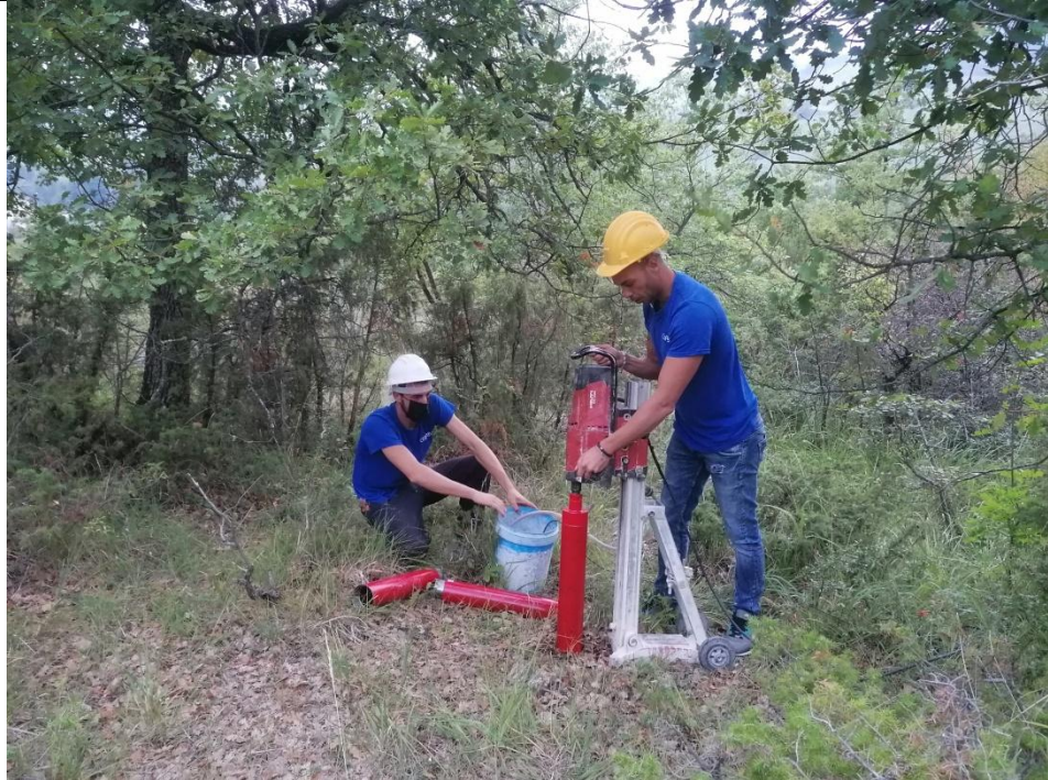
Esecuzione carotaggio P.77