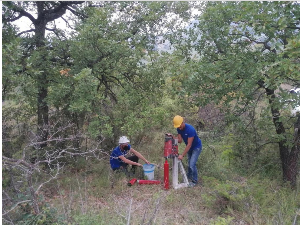
Esecuzione carotaggio P.77