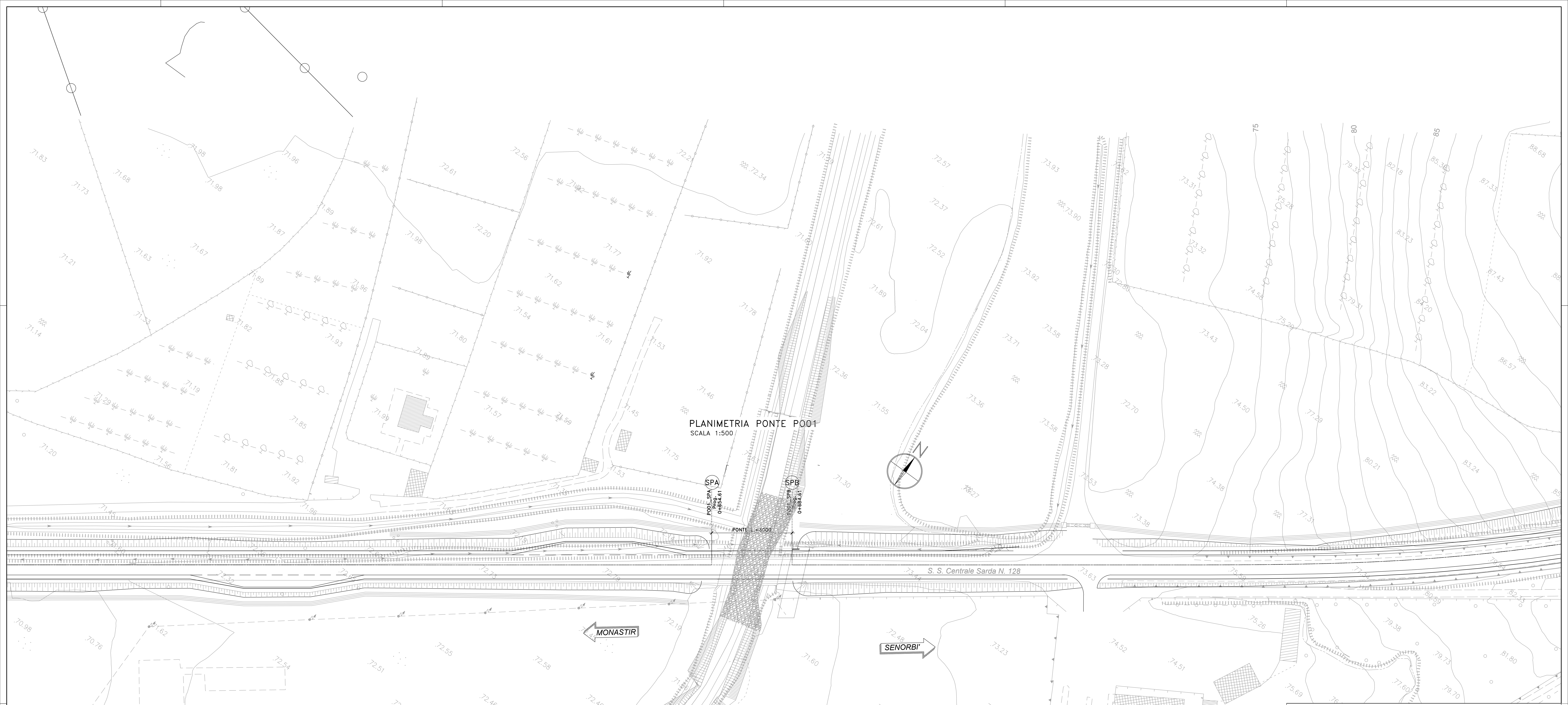
PLANIMETRIA PONTE PO01 SCALA 1:500