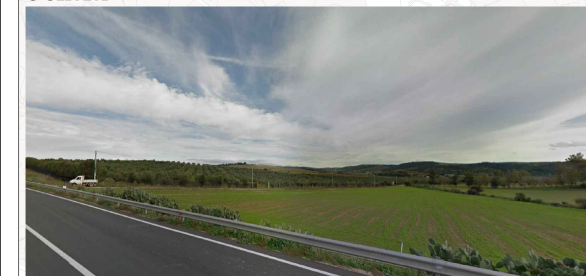
9- LINEA FERROVIARIA CAGLIARI-ISILI