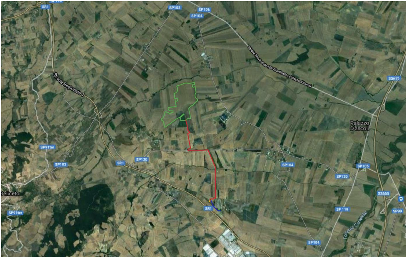
Figura 5 – Localizzazione progetto con layout di impianto (verde) ed opere di connessione