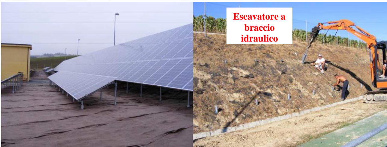
Figura 7 - Esempio di posa delle strutture portanti

I pannelli fotovoltaici saranno posizionati su uno scheletro di acciaio avente la base direttamente inserita nel terreno; non vi sarà quindi una piattaforma di cemento. Per la posa del basamento in acciaio si prevede l'utilizzo di un battipalo come indicato nella seguente figura: