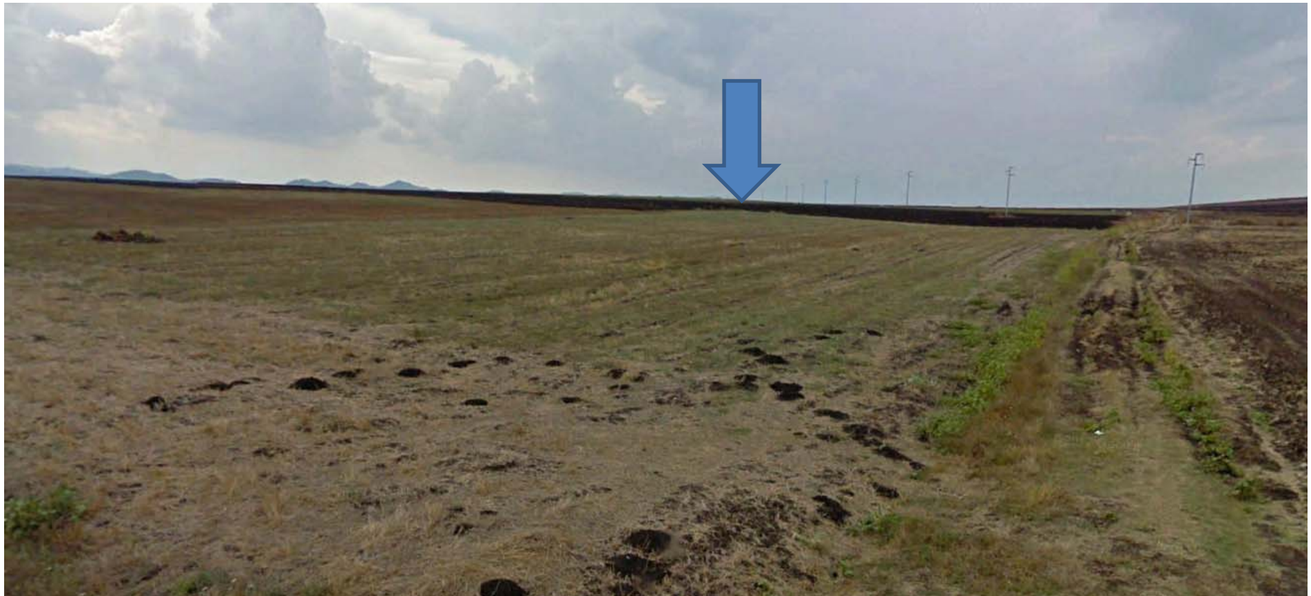
Foto 14 – turbina B02 (ripresa fotografica dalla strada comunale)