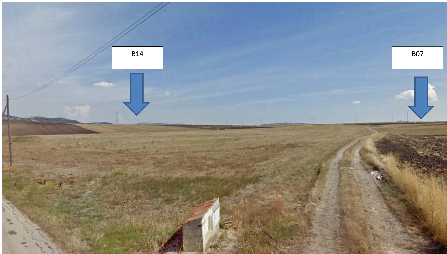
Foto 7 – turbina B14 e B07(ripresa fotografica dalla zona limitrofa all'isola ecologica)