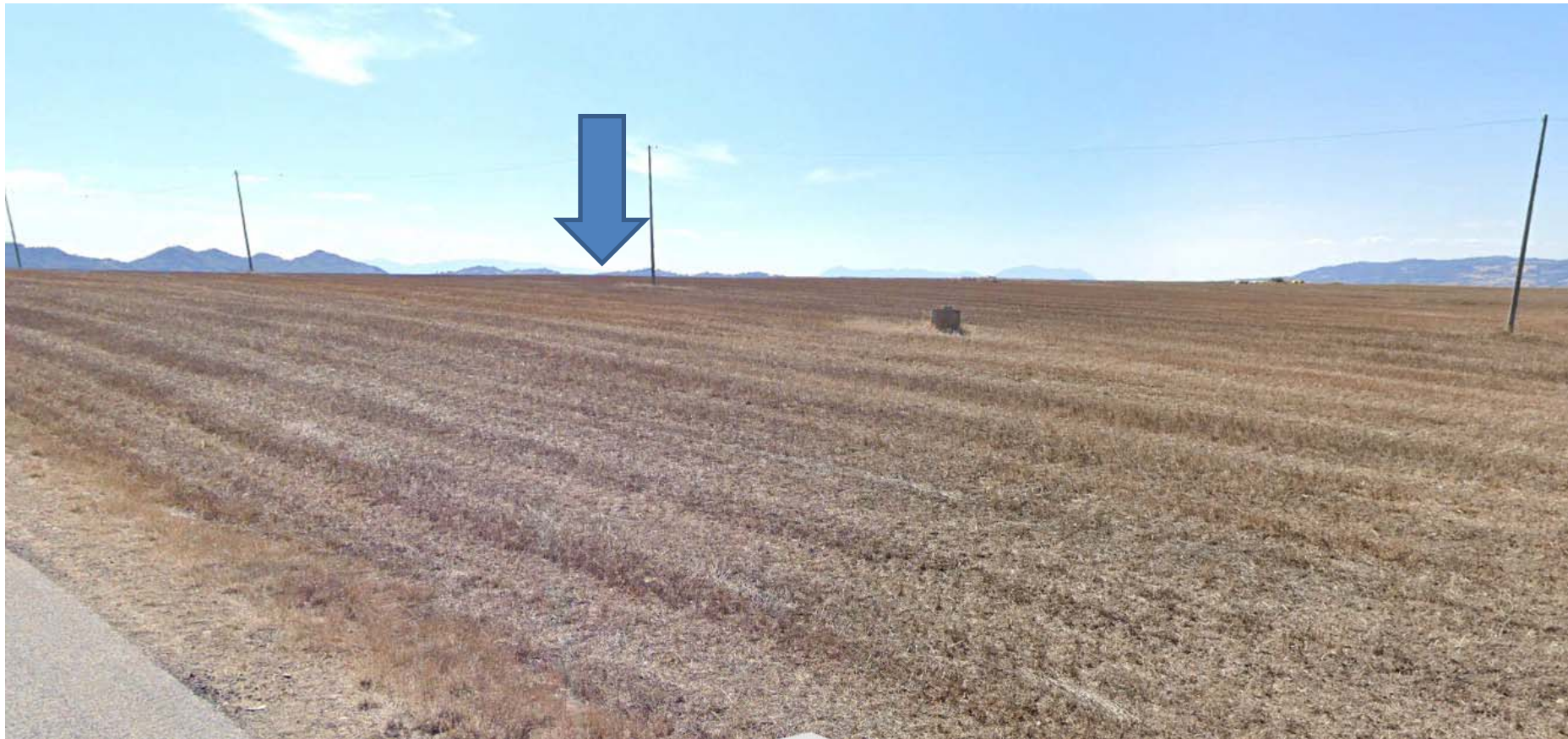
Foto 9 – turbina B11 (ripresa fotografica da Masseria Chiuppo di Bruno)