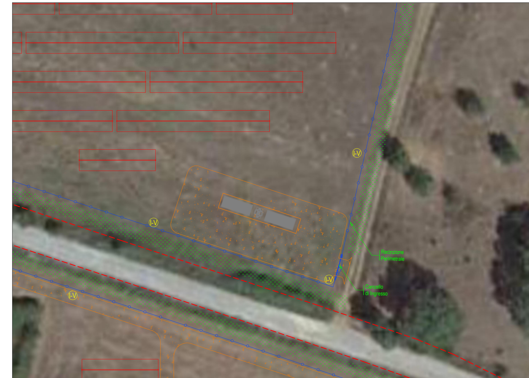
PARTICOLARE INGRESSO SC-2-I1 scala 1:500