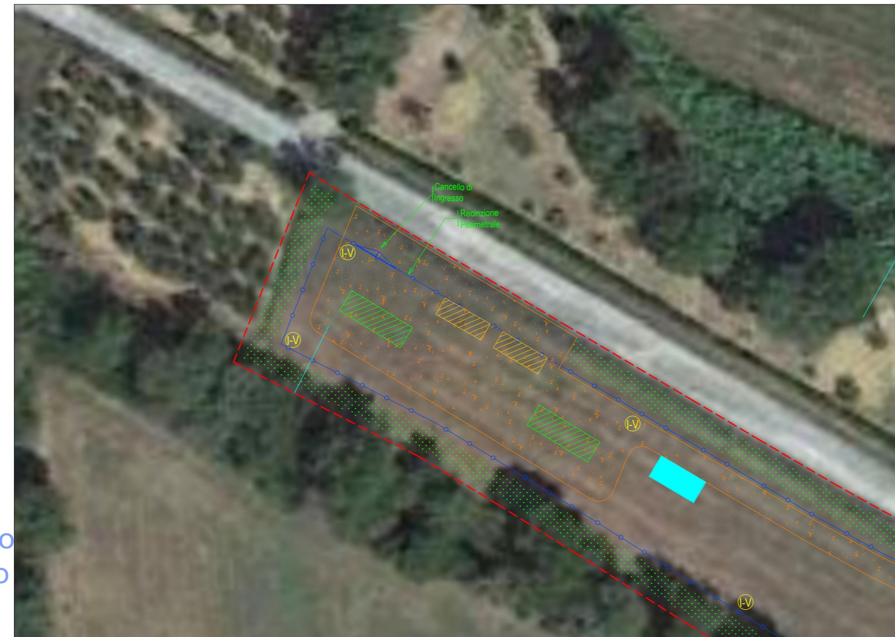
PARTICOLARE INGRESSO SC-1-I1 scala 1:500