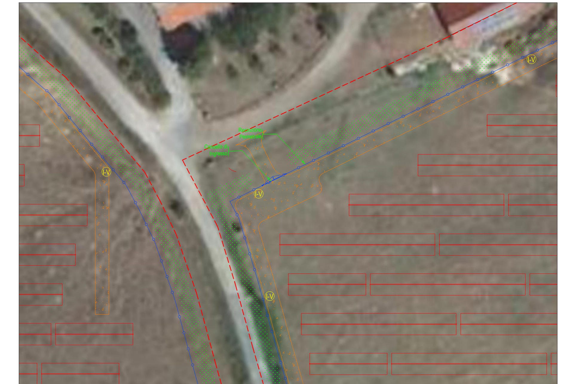
PARTICOLARE INGRESSO SC-2-II scala 1:500