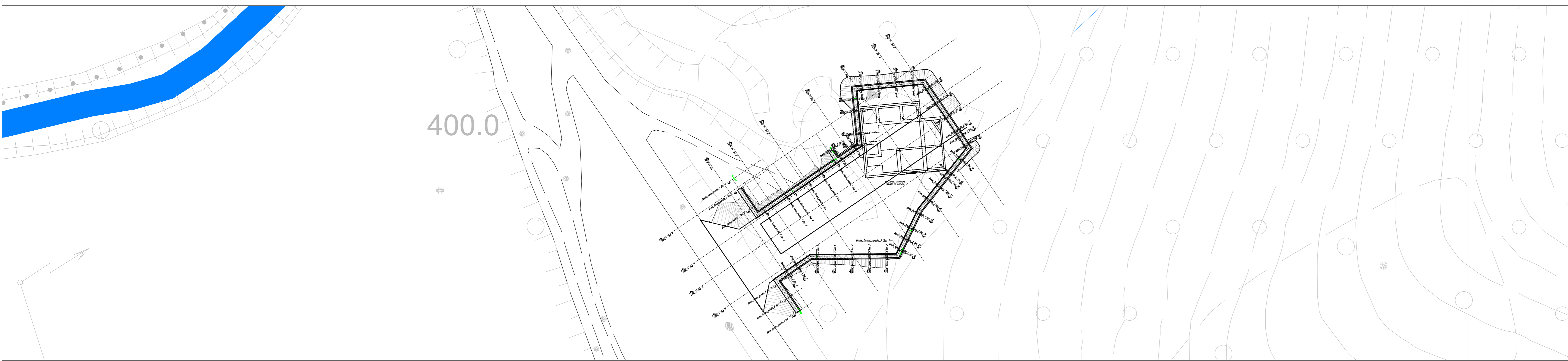
PLANIMETRIA GENERALE - FASE DI CANTIERE - SCALA 1:500