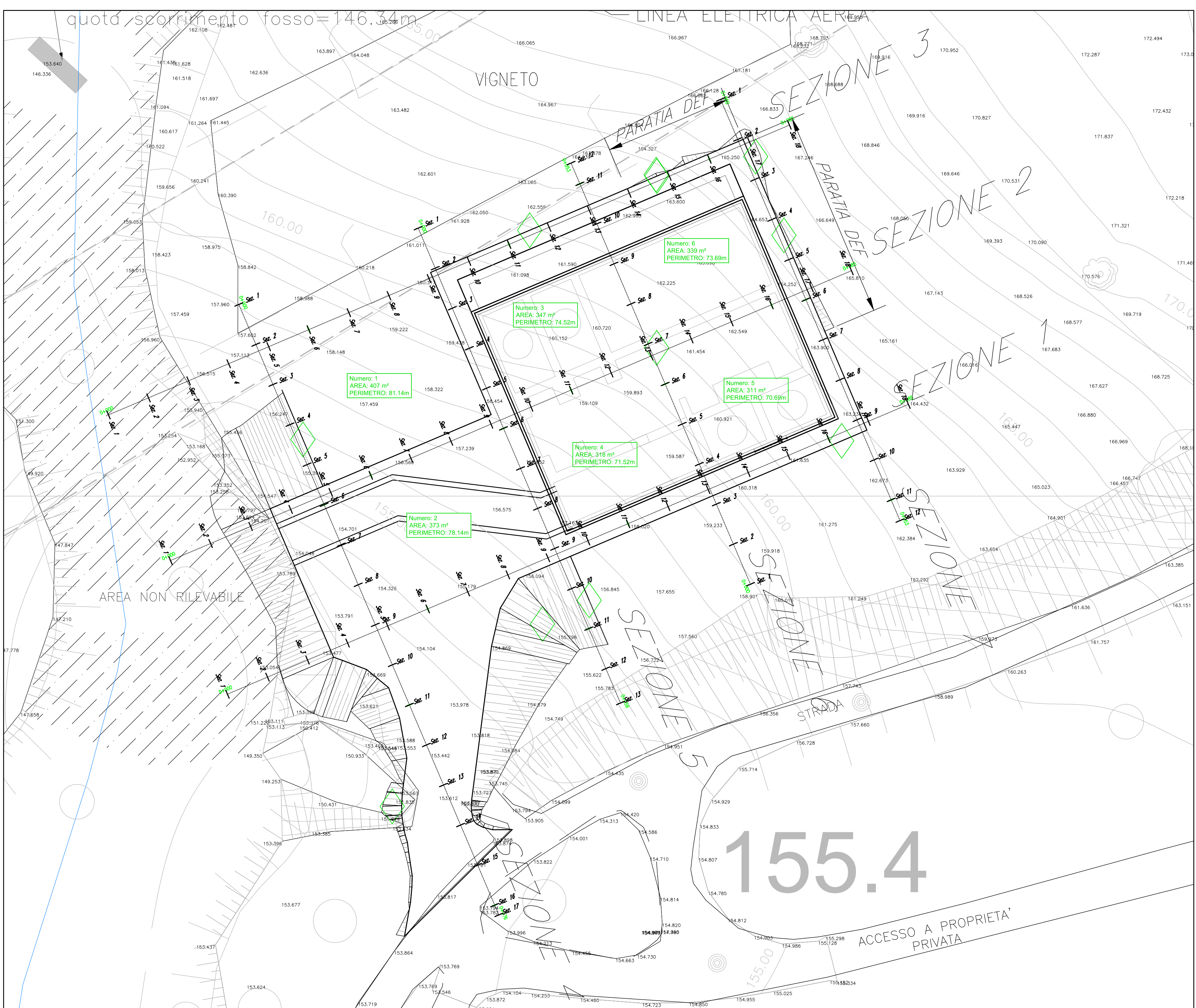
PLANIMETRIA DELLE OPERE IN PROGETTO SCALA 1: 200