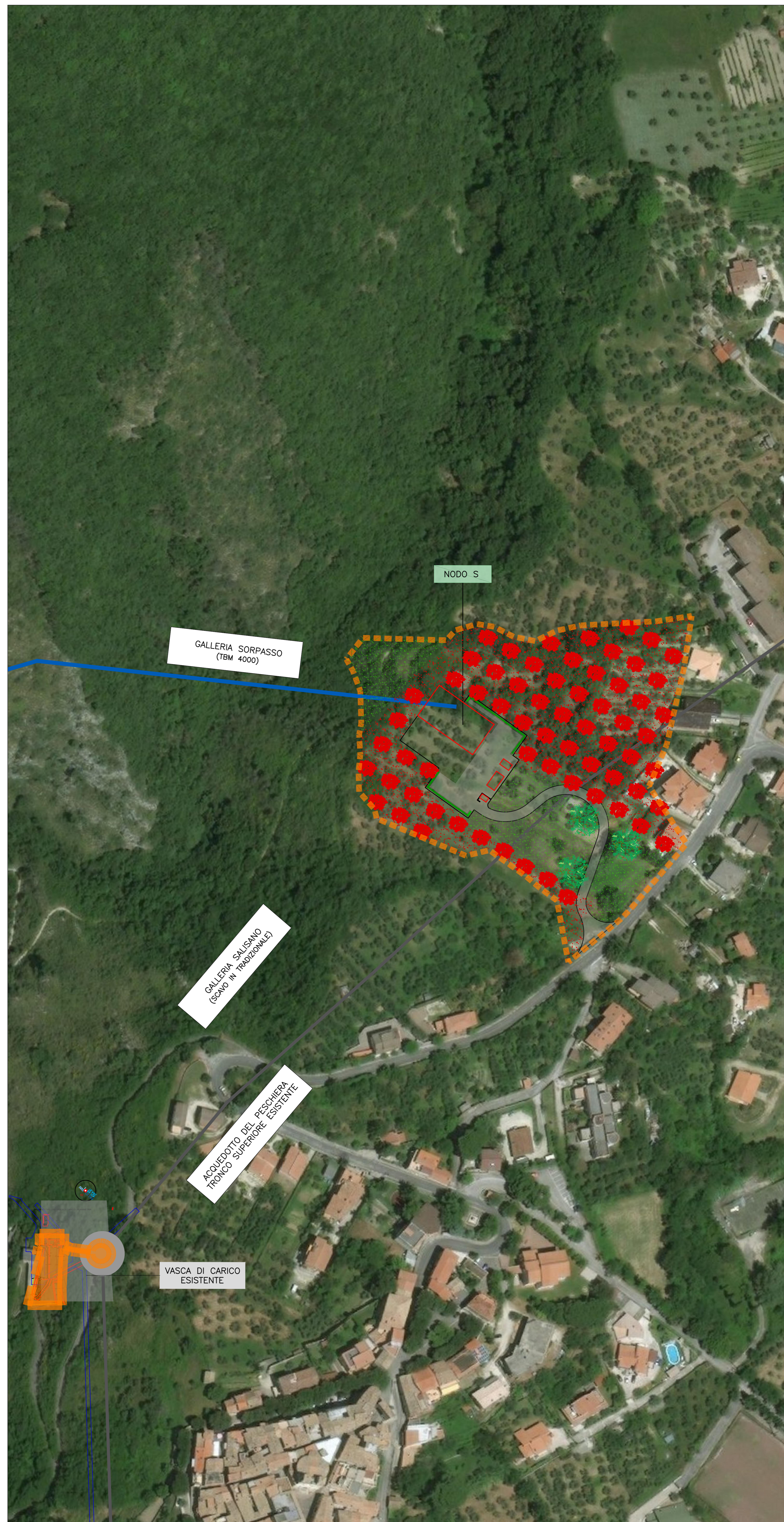
COROGRAFIA 1:1000 POST OPERAM