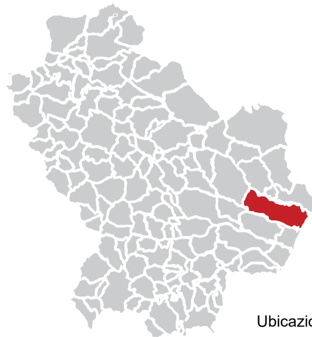
Ubicazione Comune di Pisticci