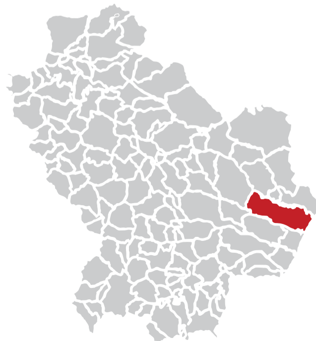
Ubicazione Comune di Pisticci