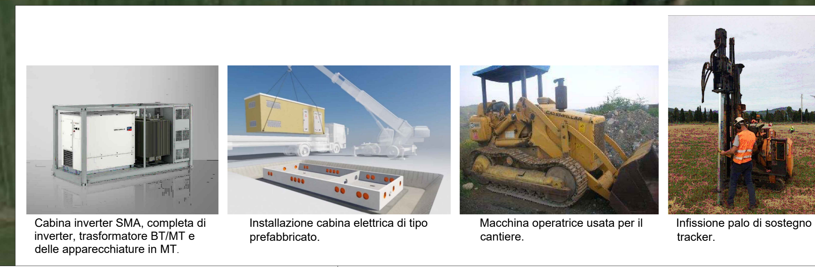
Cabina inverter SMA, completa di inverter, trasformatore BT/MT e delle apparecchiature in MT. Installazione cabina elettrica di tipo prefabbricato. Macchina operatrice usata per il cantiere. Infissione palo di sostegno tracker.