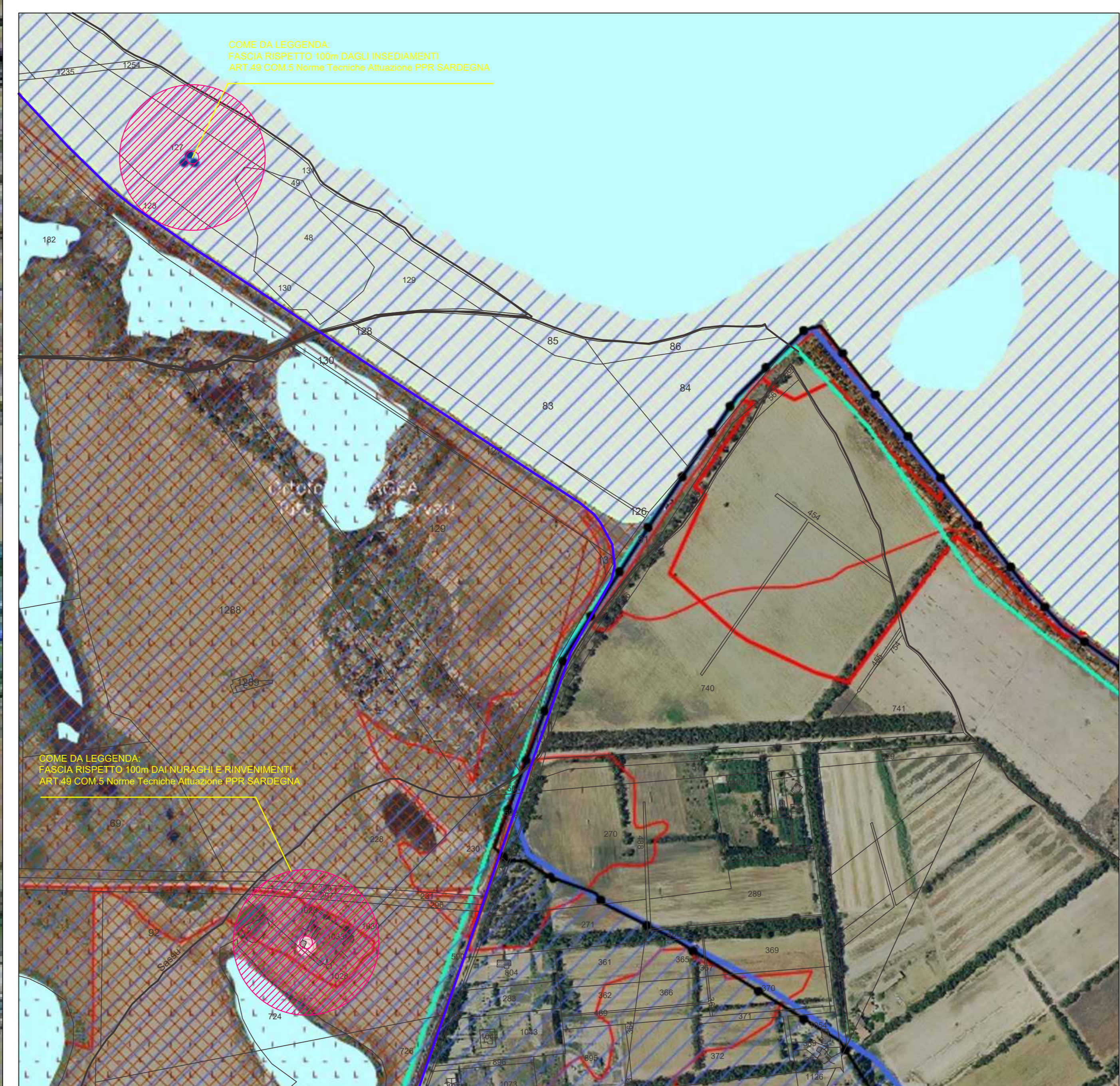
DETTAGLIO 2 TRATTO CAVIDOTTO CON SOVRAPPOSIZIONE E.D.M. FOGLIO N°19-26-16 CATASTALE SCALA 1:100