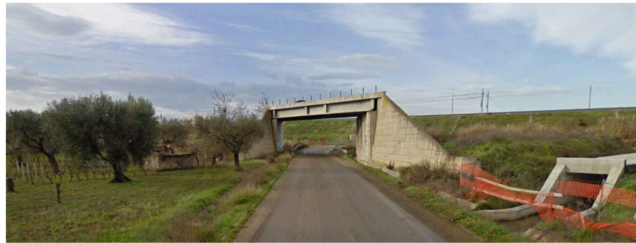
Foto B.6 - Parallelismo Linea MT