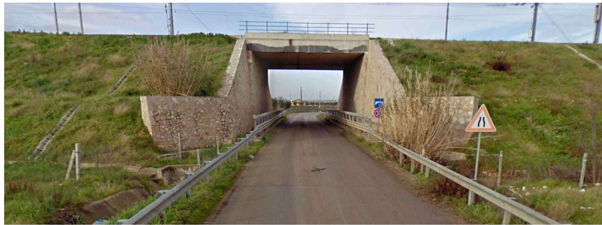
Foto B.5 - Attraversamento Ponte