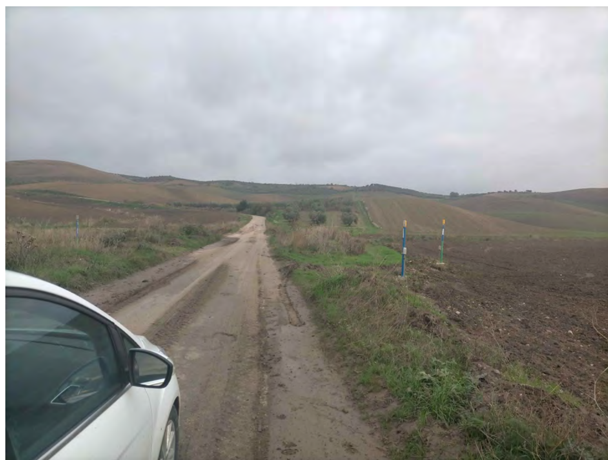
Foto INT.55 - Attraversamento Reticolo Idrografico