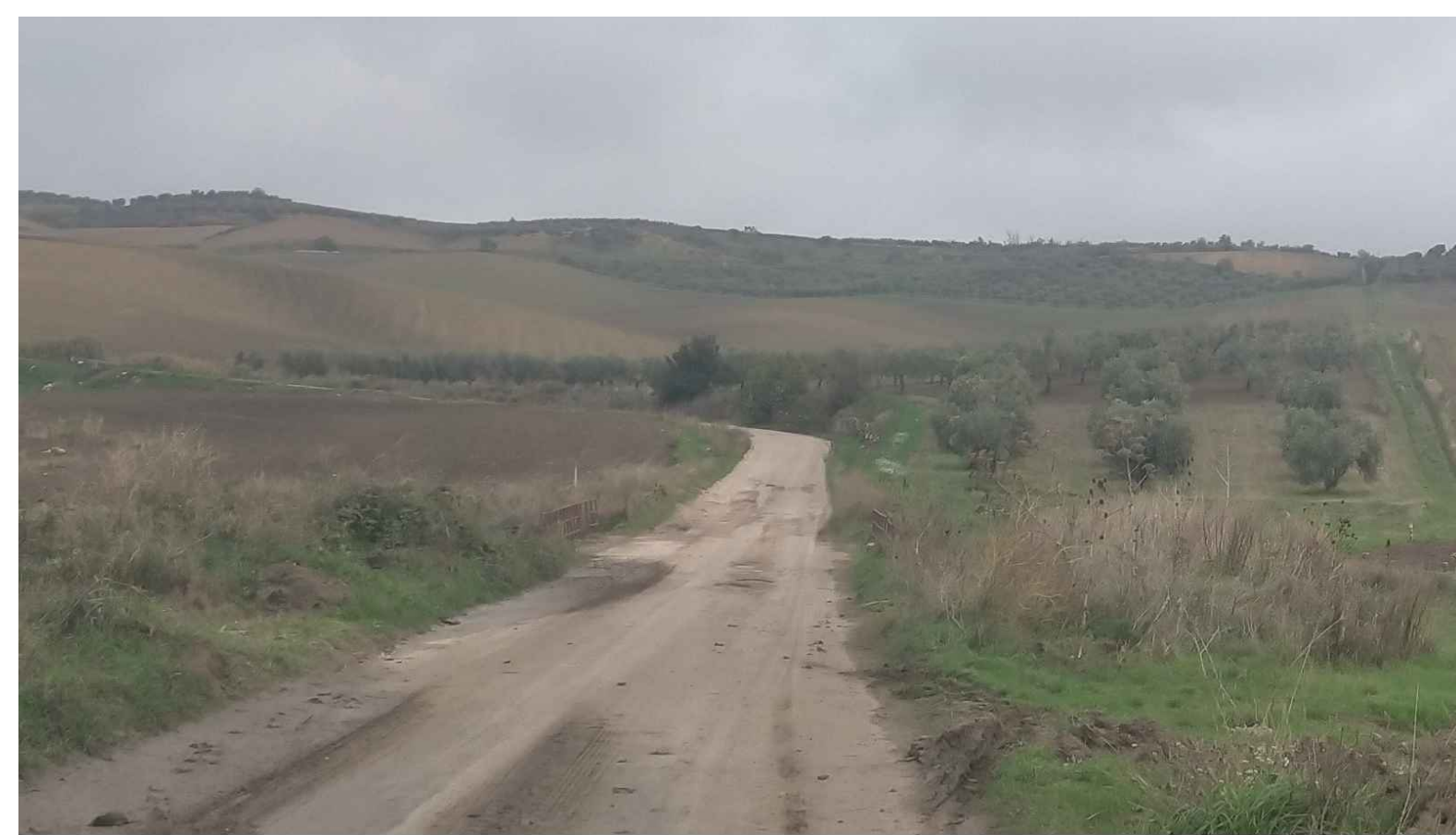
Foto INT.44 - Parallelismo Acquedotto Soprelevato