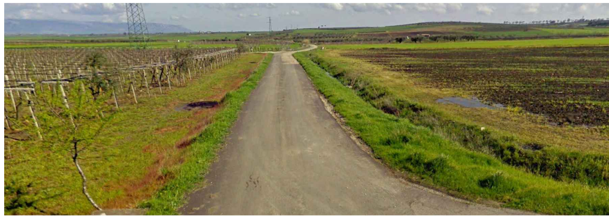
Foto INT.30 - Parallelismo Ponte e Reticolo Idrografico