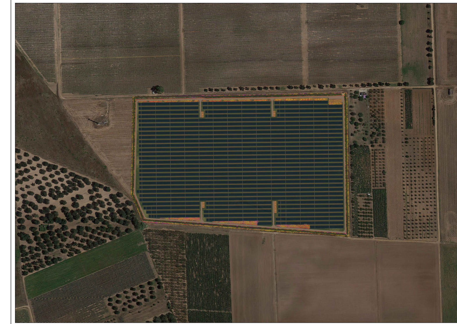
FOTOINSERIMENTO SU ORTOFOTO