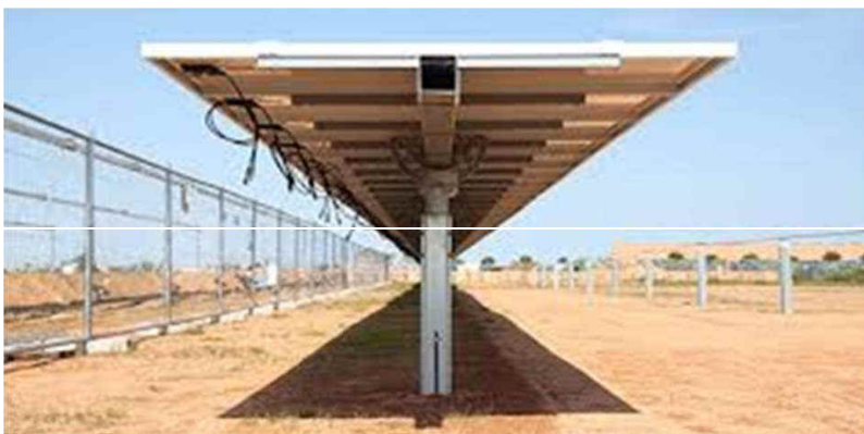
Figura 4 - particolare d'installazione