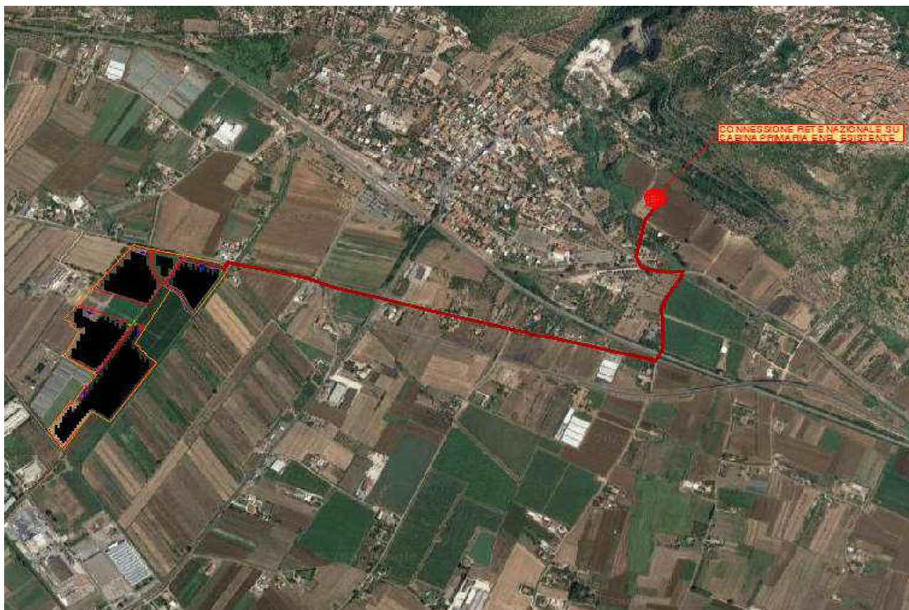
Figura 1 - Localizzazione del sito rispetto al territorio circostante e infrastrutture stradali presenti

L'area che ospiterà l'impianto si trova ad una altitudine media tra 5,5 e 8,0 metri sul livello del mare, a 1,7 km circa dal centro di Sezze Scalo, e 5 km circa dall'abitato di Sezze, ed è facilmente raggiungibile dalla S.S.156 dei Monti Lepini che transita a poche centinaia di metri.