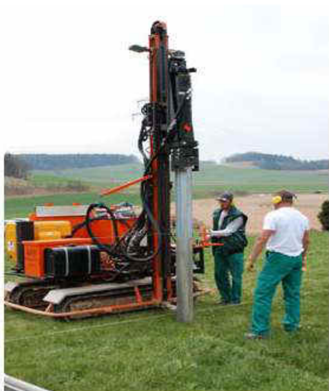
Figura 5 - particolare d'installazione