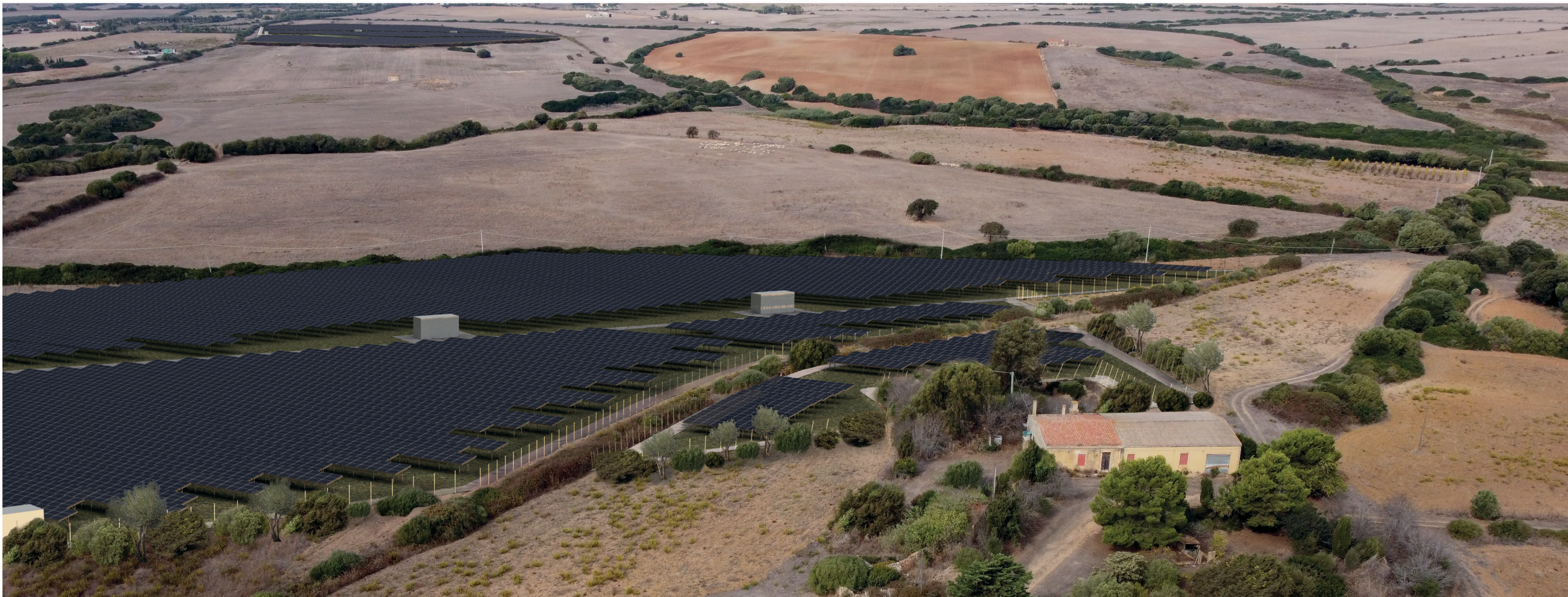
FOTOSIMULAZIONE PROSPETTICA DELL'IMPIANTO VISTA A