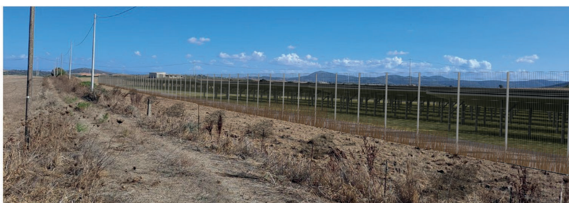
FOTOSIMULAZIONE DA TERRA SENZA MITIGAZIONE VISTA C