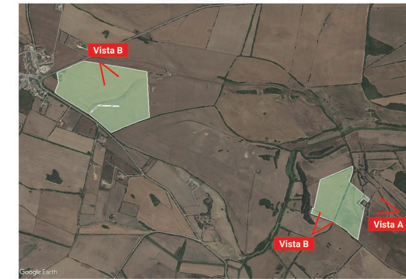
INQUADRAMENTO IMPIANTO STINTINO CONI OTTICI