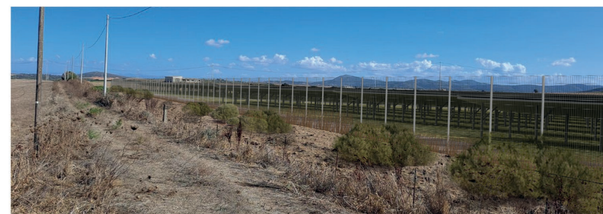
FOTOSIMULAZIONE CON OPERE DI MITIGAZIONE (LENTISCO) VISTA C