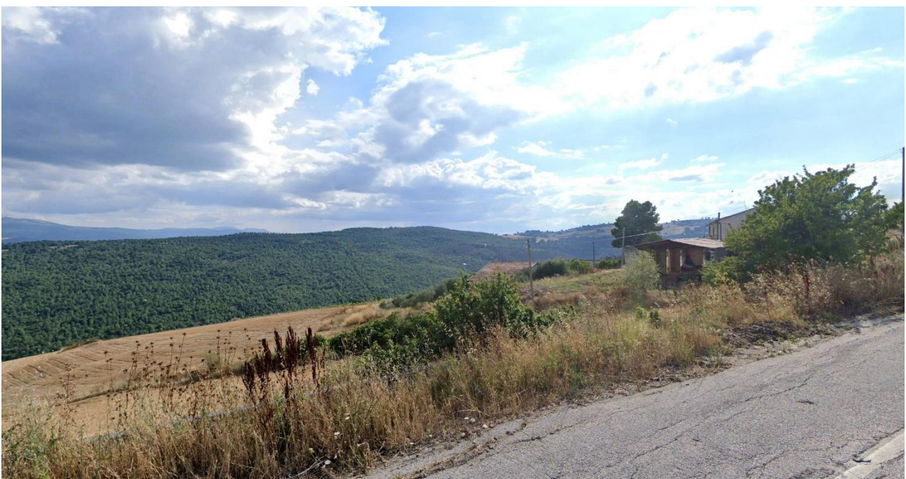
03 – Vista lungo SP156 Strada Com.le Aquilonia Stazione verso Ovest