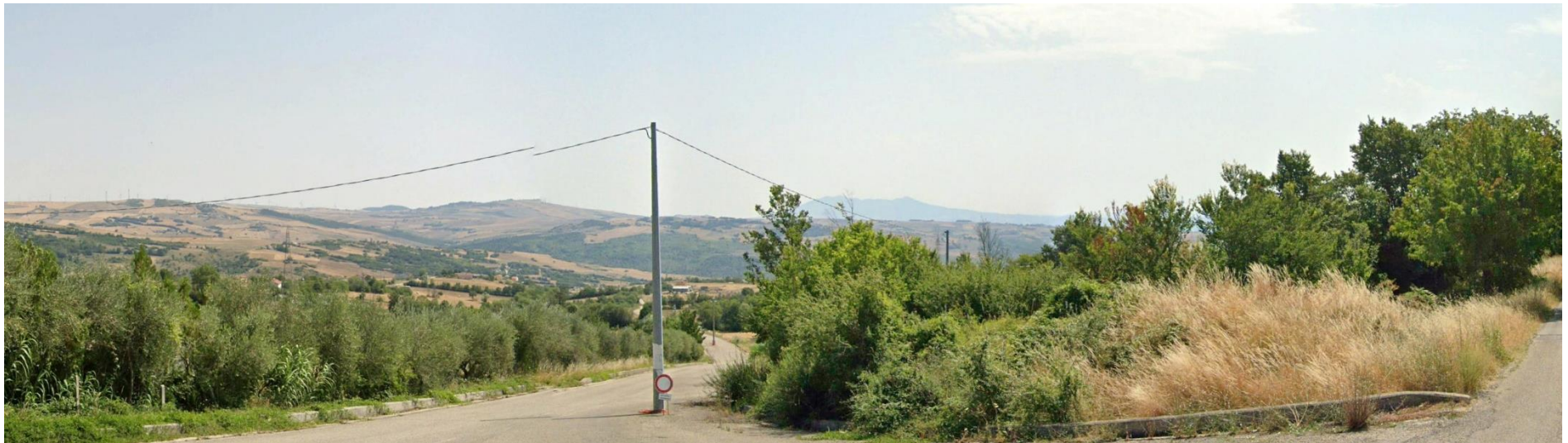
28 – SS91 bivio C.da Castelluccio (Area Urbana di Andretta) verso Est