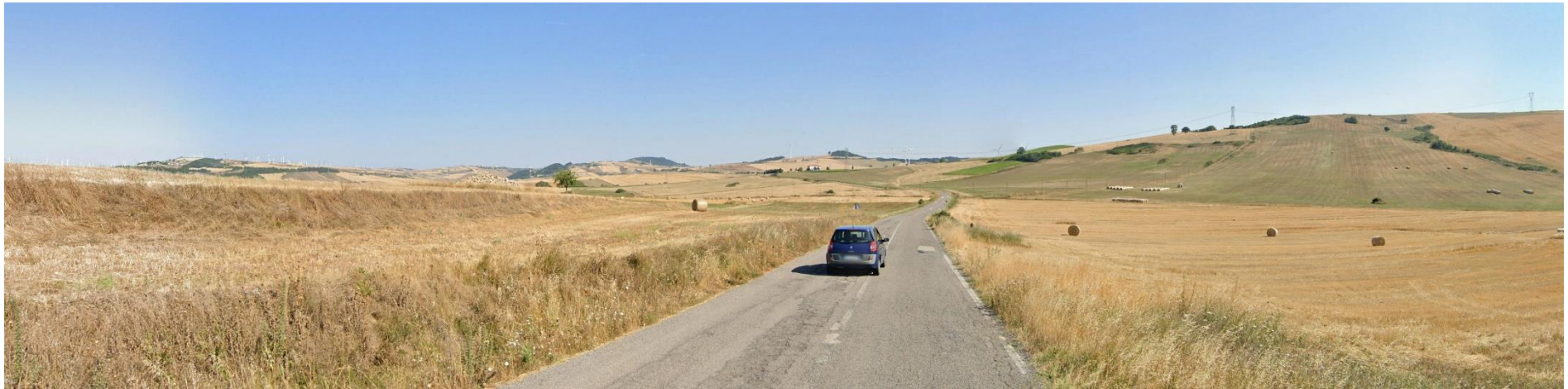
15 – SS399 Strada Statale di Calitri verso Nord