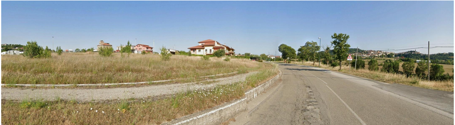
27 – SS91 Via Mattinella (Area Urbana di Andretta) verso Sud/Est