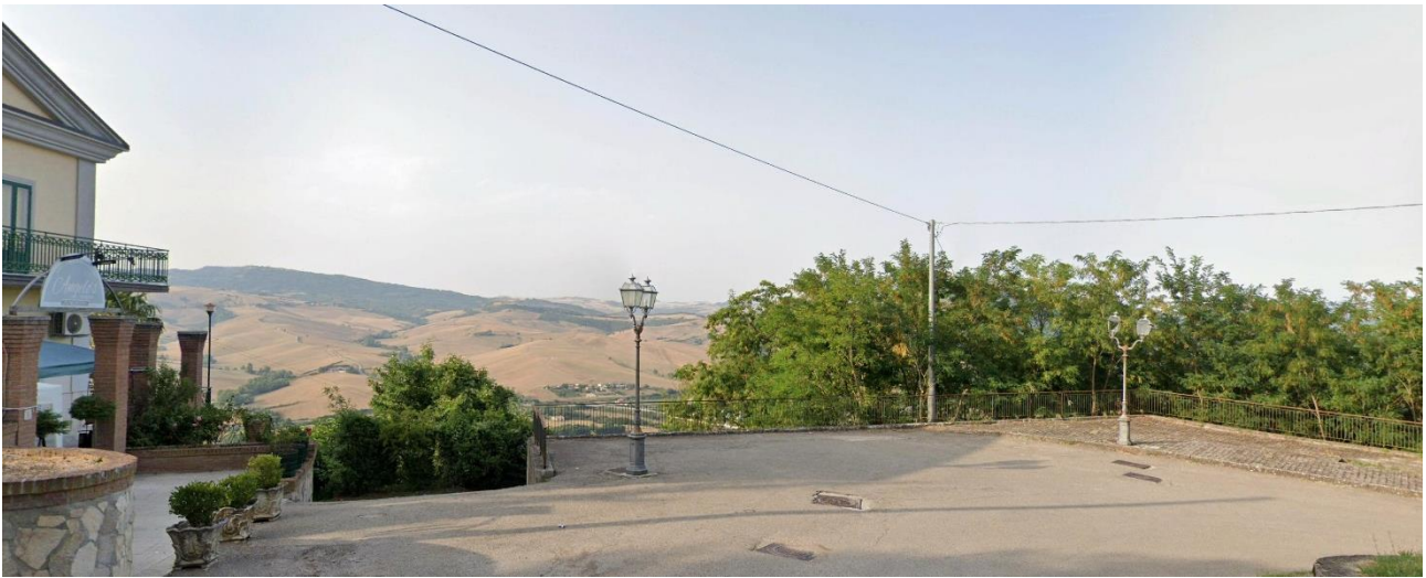
32 – Via Belvedere Belgio (presso Area Urbana di Conza della Campania) verso Nord/Est