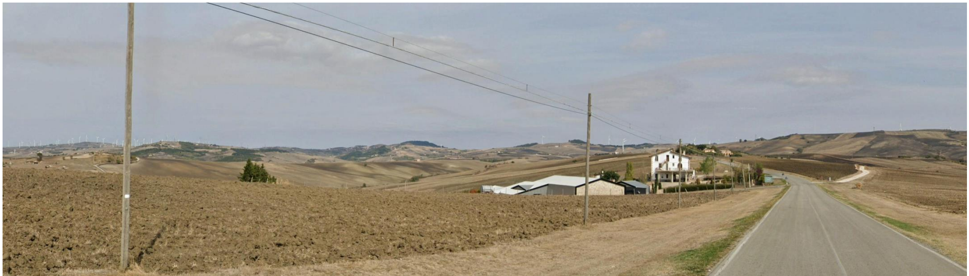
12 – Dalla SS399 Strada Statale di Calitri verso Nord/Ovest