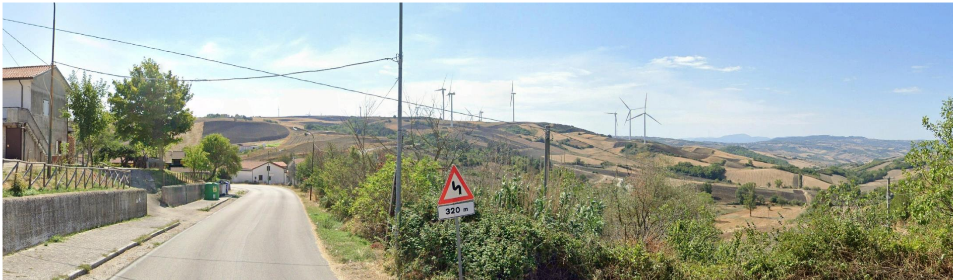
24 – SS91 C.da Sferracavallo (loc. Sferracavallo - Comune di Vallata) verso Sud/Est