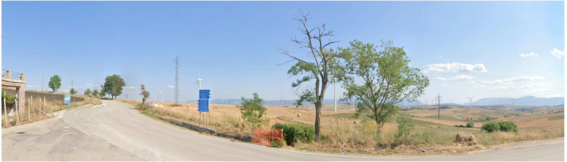
21 – Bivio SS303 Strada Statale del Formicoso e SS91 C.da Toppagallo verso Sud/Est (Area SE Bisaccia)