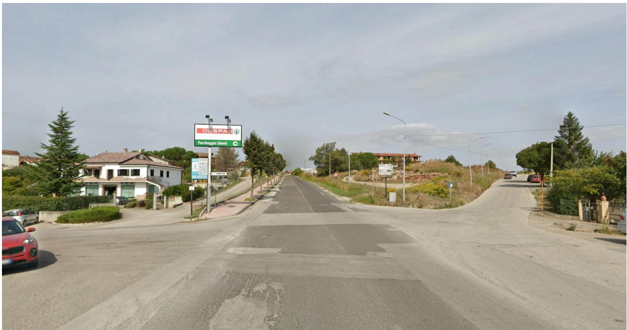
08 – SS399 di Calitri (Centro Urbano di Calitri) verso Nord/Ovest