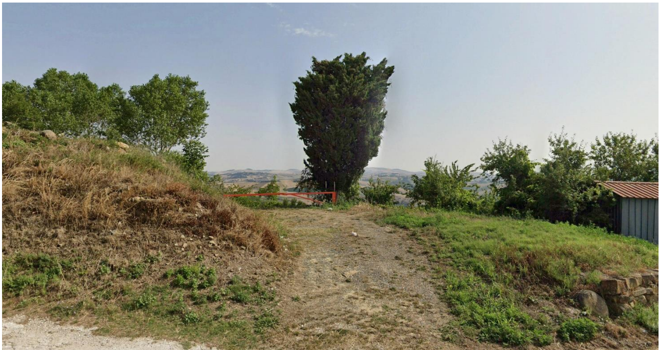
39 – SC Cairano – Ofantina (Area Urbana Cairano) verso Nord