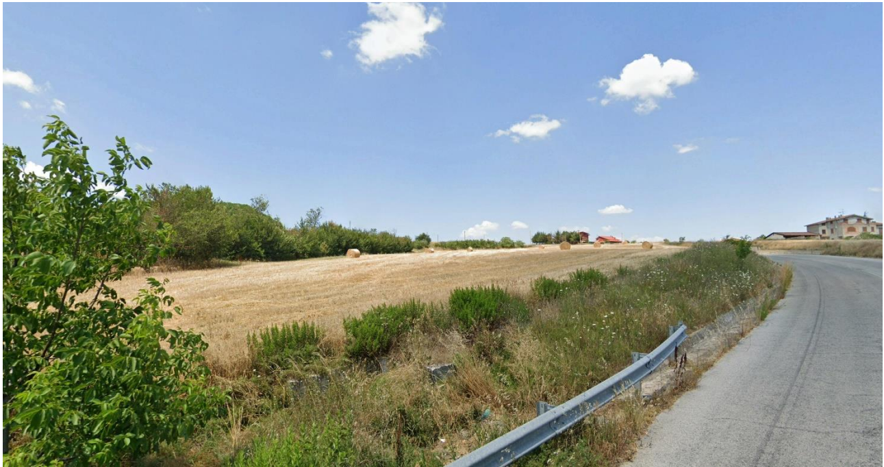
09 – A Nord di C.da delle Paludi (Area Urbana di Calitri) verso Nord/Ovest