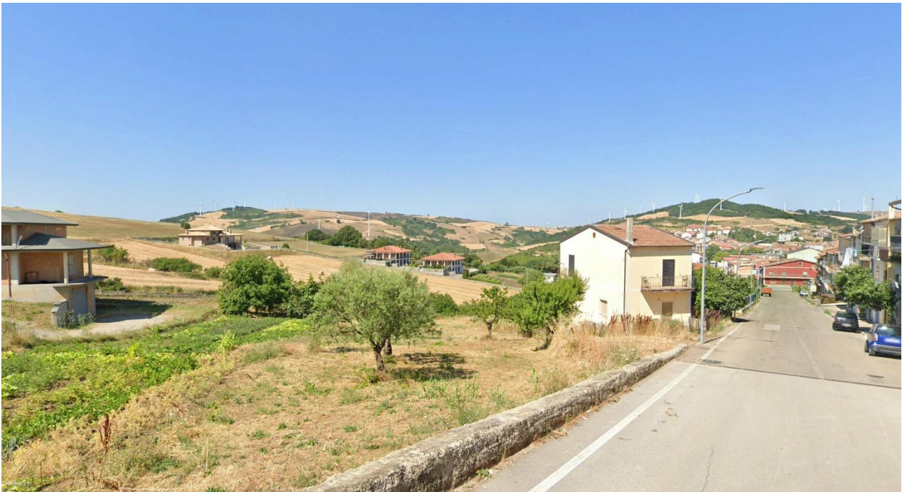
01 – Vista dal centro urbano di Aquilonia Via Circonvallazione Di Destra verso Nord/Ovest