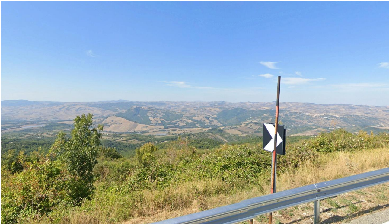
36 – SS7 Appia (Area Urbana Pescopagano) verso Nord/Ovest