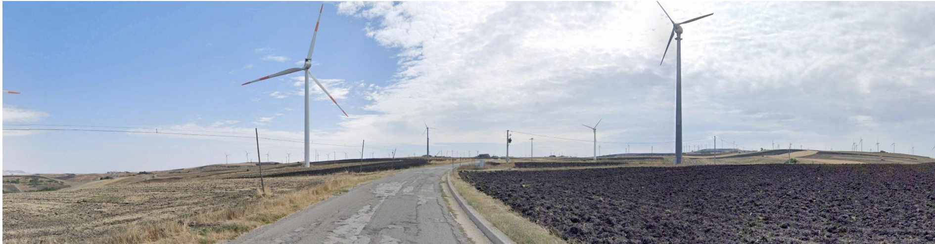
23 – SS91 C.da Serra dell’Orco (Comune di Vallata) verso Sud/Est