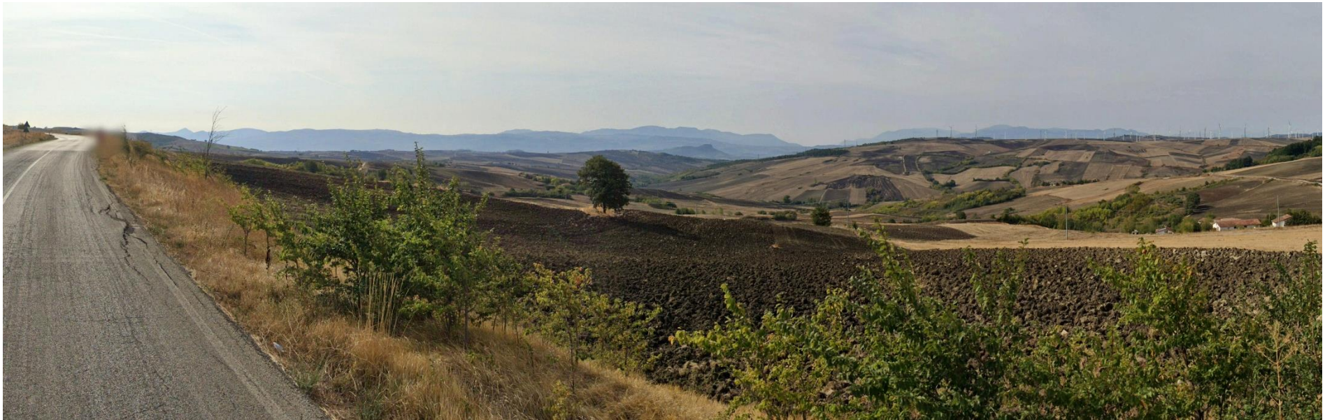
16 – SS399 verso Sud (nei pressi del limite urbano di Bisaccia)