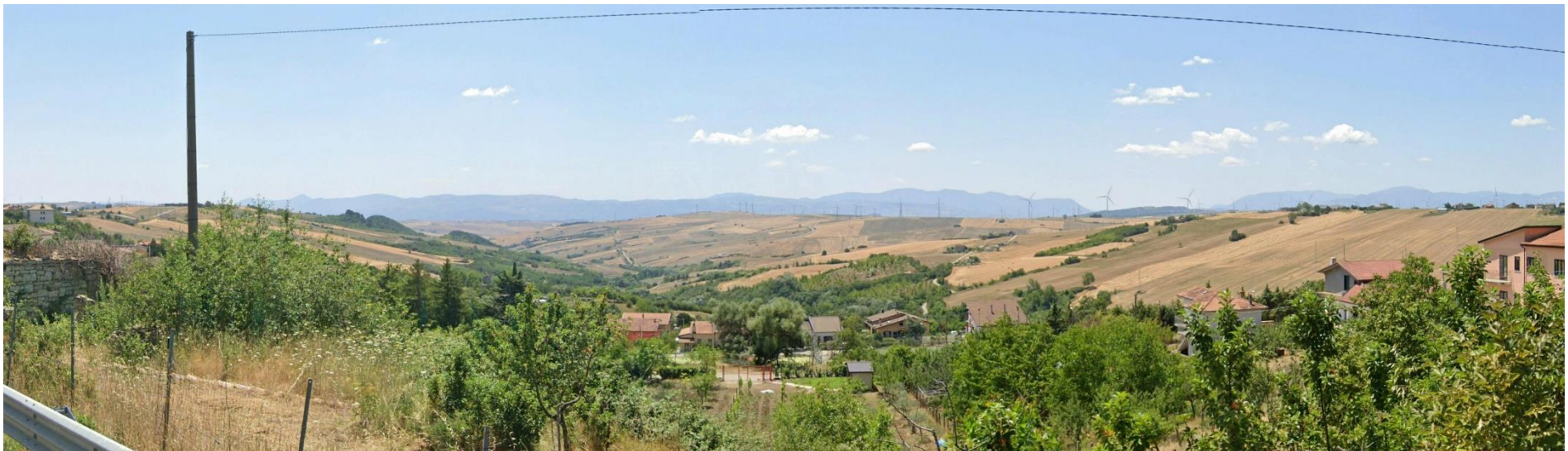
18 – SS303 Via XXIII Luglio – (Area Urbana di Bisaccia) verso Sud