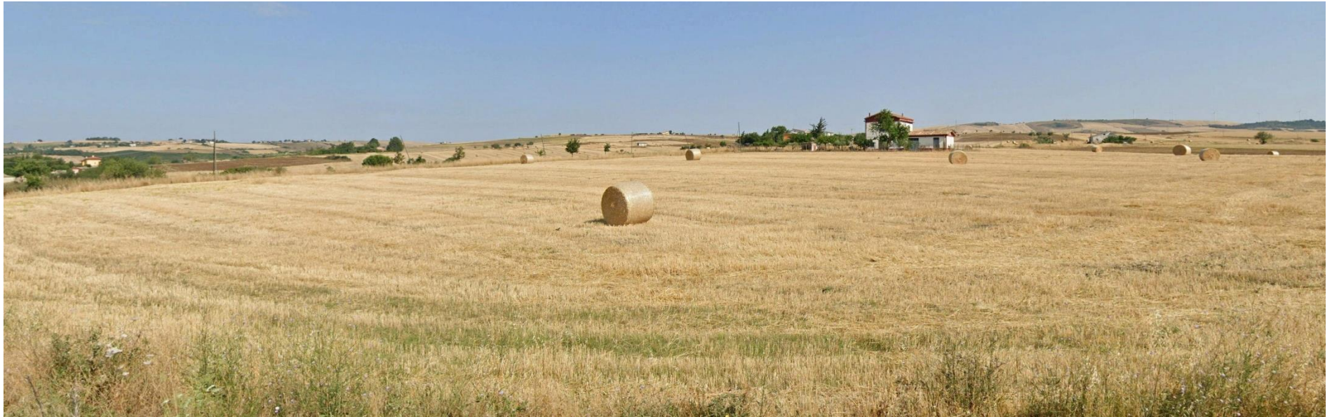
13 – Dalla SP231 nei pressi di loc. Piano dei Monti verso Nord/Ovest