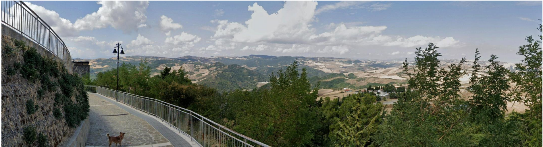
25 – Via Belvedere (Centro Urbano di Monteverde) verso Ovest