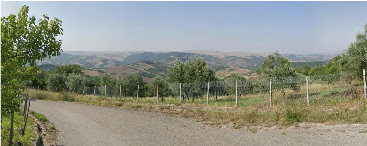
37 – Loc. San Lorenzo (Comune di Pescopagano) verso Nord/Ovest