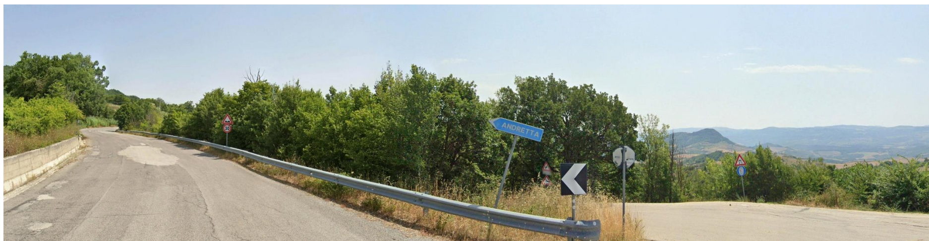
30 – SS91 bivio SP140 in direzione Nord/Est (Comune di Andretta)