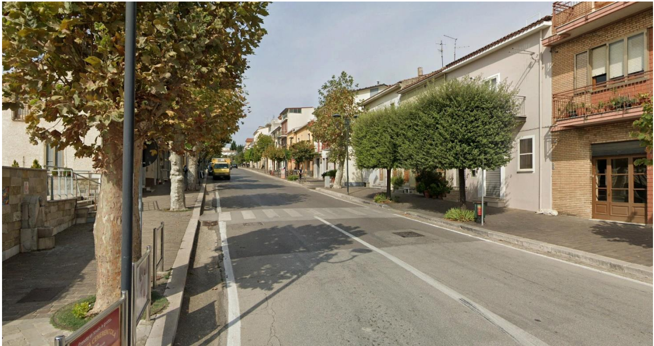
07 – lungo SP81 Corso Giuseppe Garibaldi (Centro Urbano Calitri) verso Nord/Ovest