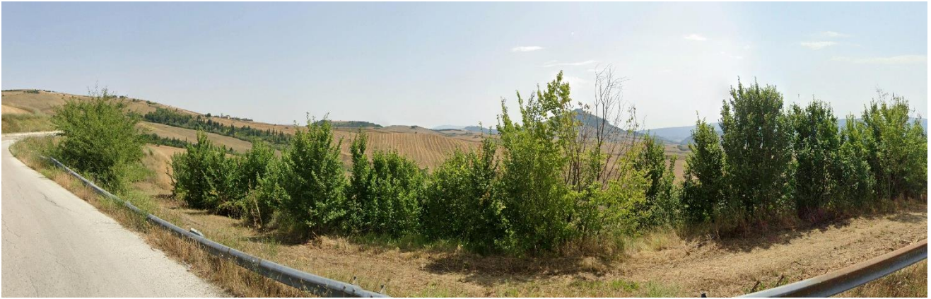
31 – SS91 in direzione Nord/Est (Comune di Conza della Campania)