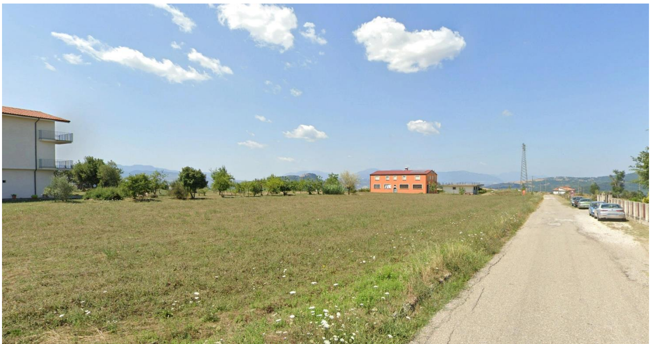
10 – Dalla SS399 a Nord del toponimo Croce Penta in direzione Ovest (Area Urbana di Calitri)