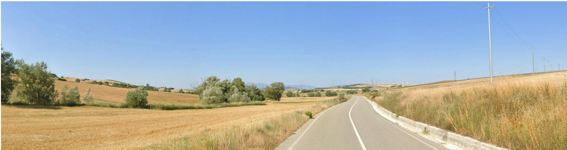
41 – C.da Terzi Ducali / C.da Terzi Spinelli (Comune di Bisaccia) verso Sud