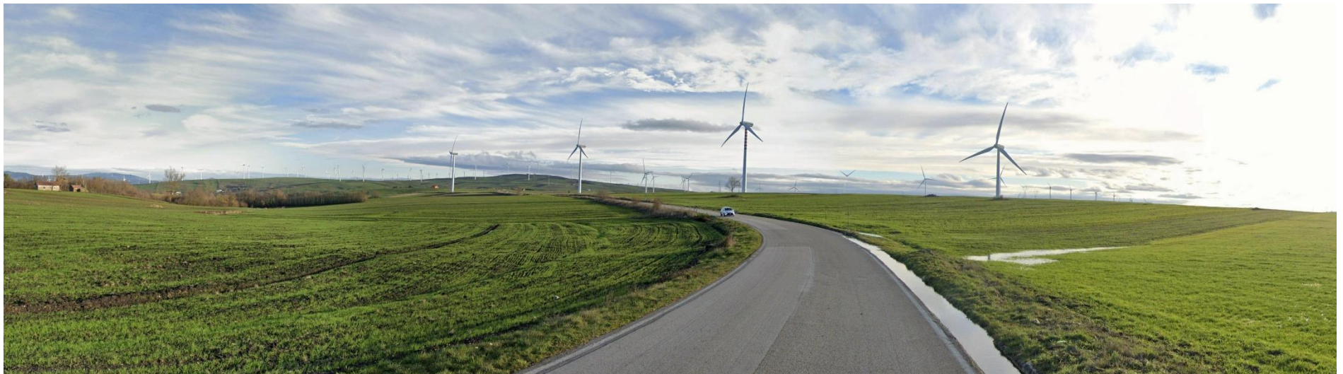
22 – SS303 Strada Statale del Formicoso verso Sud/Est (Area SE Bisaccia)