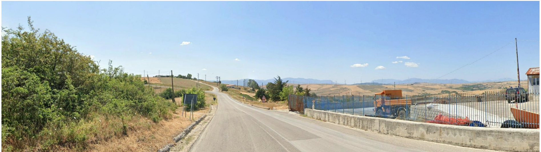
17 – Nei pressi del bivio SS399 – SS303 Strada Statale del Formicoso (Bisaccia) verso Sud