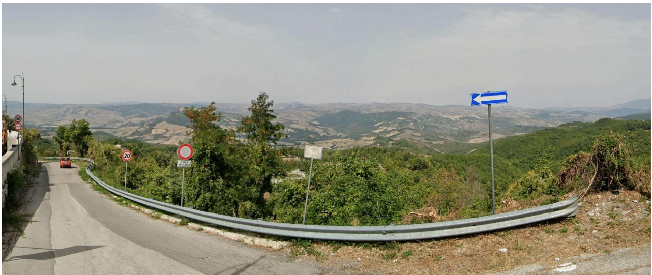
35 – SS7 Appia bivio Vico Santa Margherita (Area Urbana Pescopagano) verso Nord/Ovest