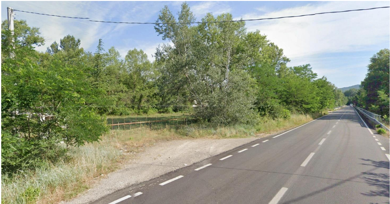
05 – lungo SS401 in direzione Nord/Ovest