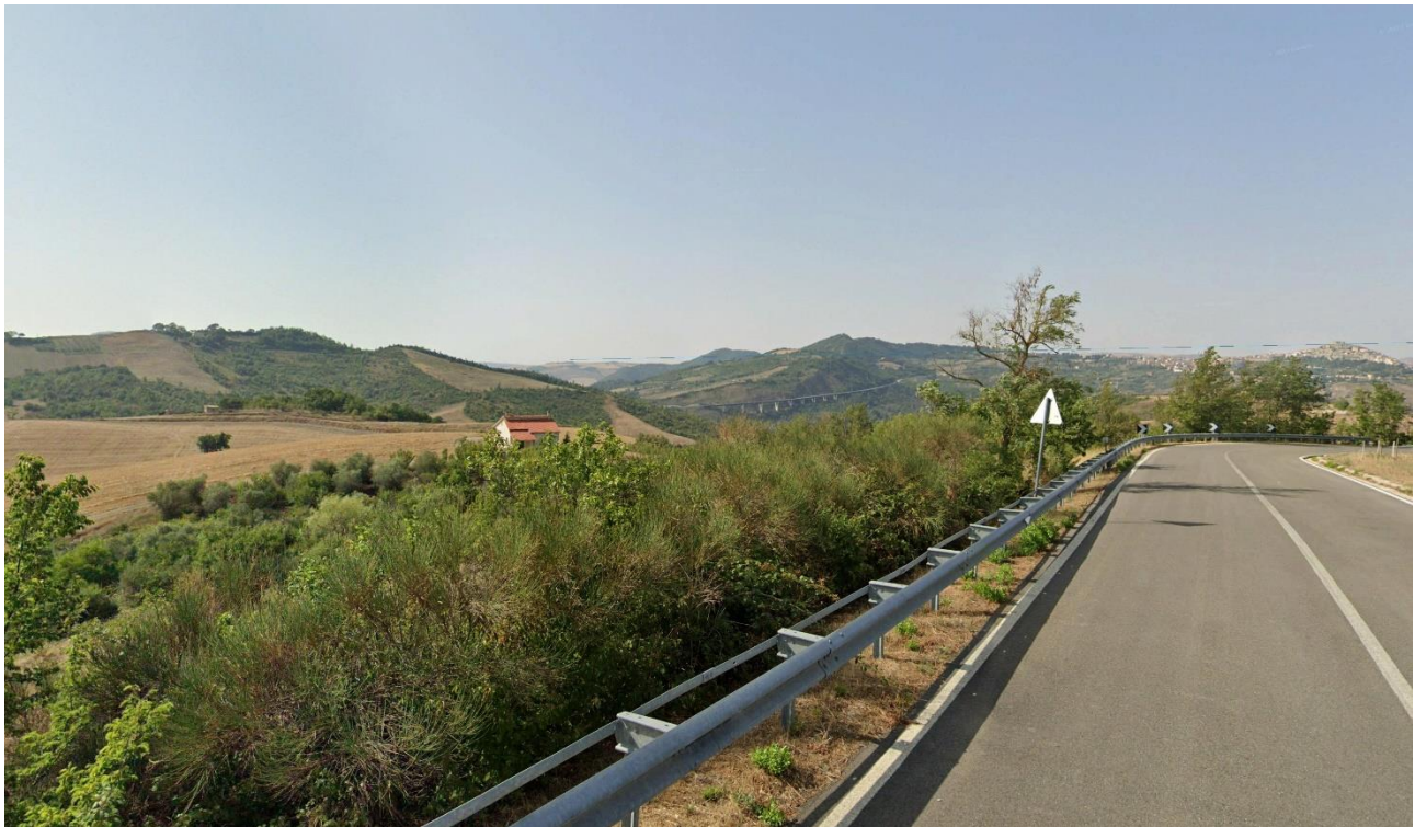
38 – SS401 (Comune di Pescopagano) verso Nord/Ovest