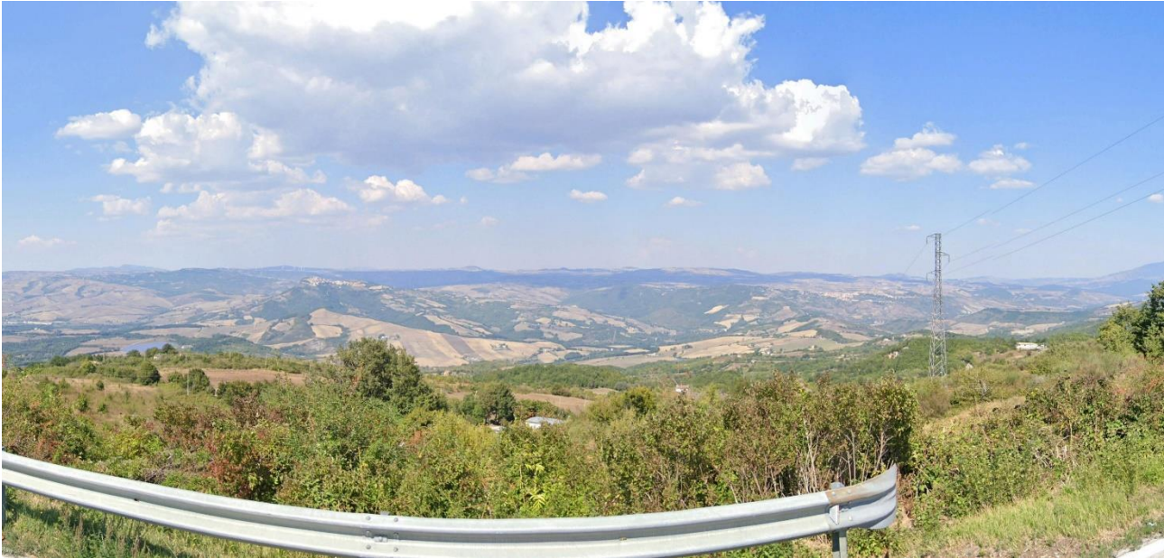
34 – SP31 C.da Montecalvo (Comune di Pescopagano) verso Nord