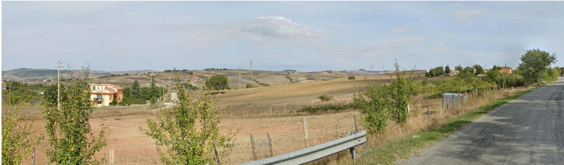
11 – Dalla SS399 Strada Statale di Calitri verso Nord