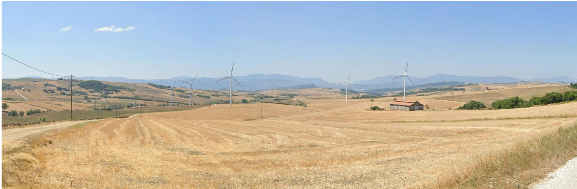
40 – SP51 C.da Aquariello (Comune di Bisaccia) verso Sud-Sud/Est