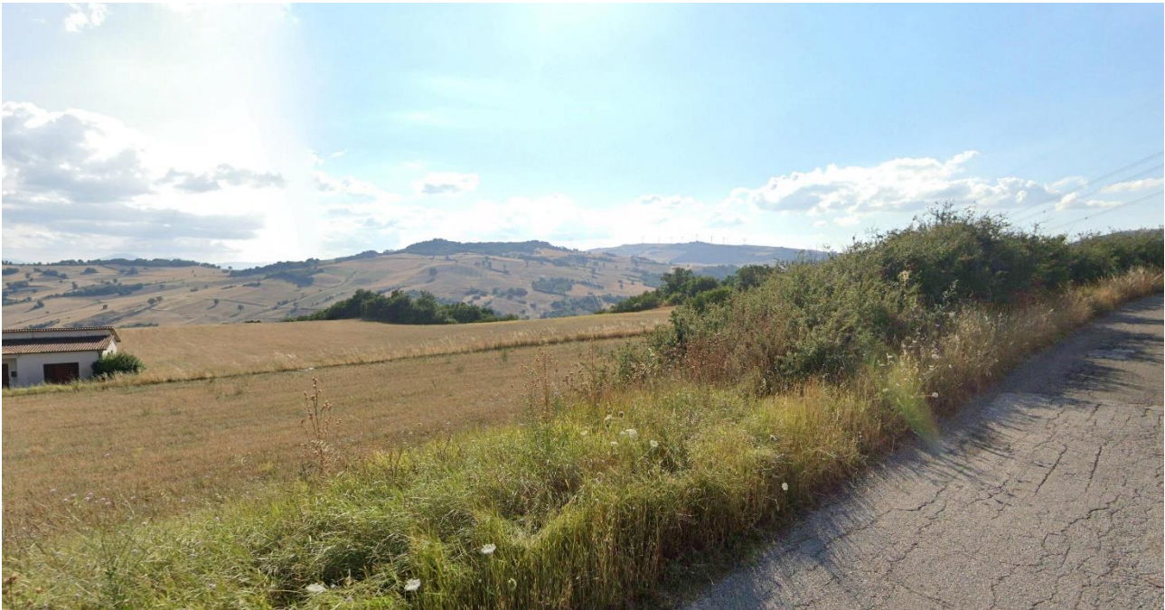
03 – Vista lungo SP156 Strada Com.le Aquilonia Stazione verso Ovest