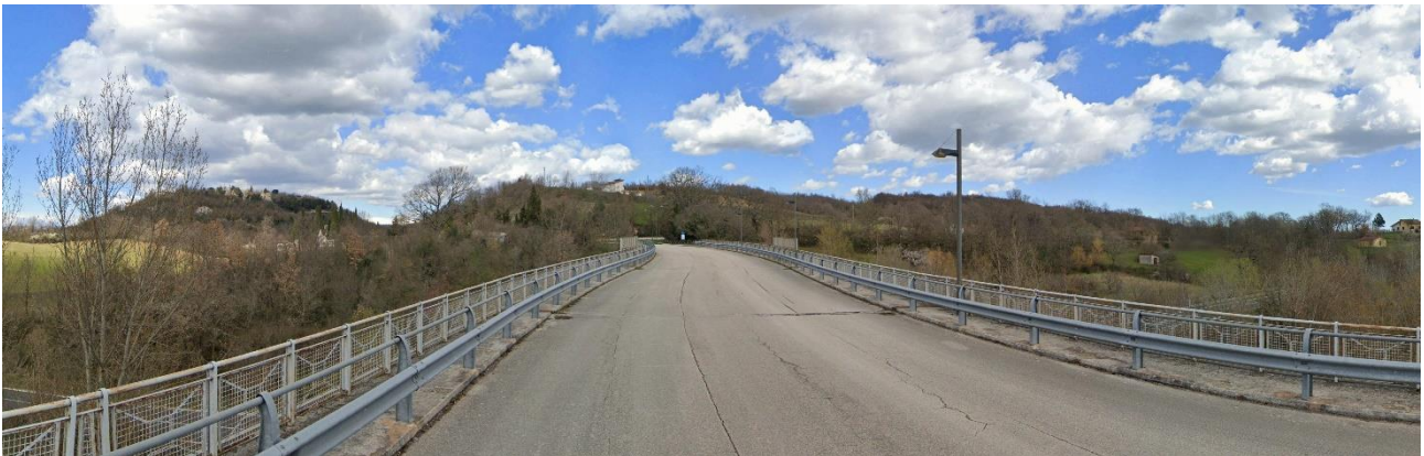
33 – Corso XXII Novembre 1980 (Area Urbana di Conza della Campania) verso Nord