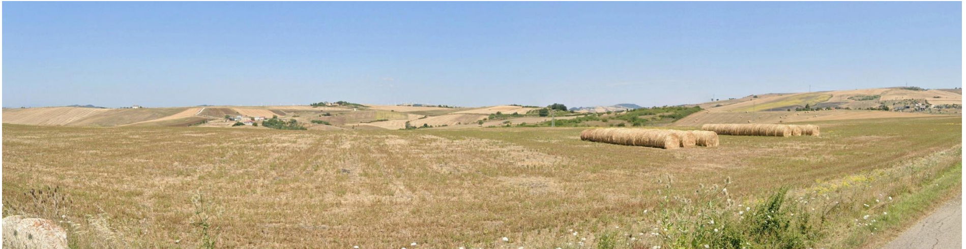
14 – Dalla Loc. Colaianca verso Nord/Ovest