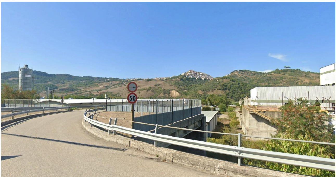
06 – lungo C.da ISCA Ficocchia (Zona ASI Calitri) in direzione Nord