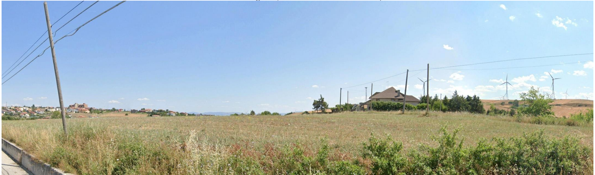
20 – SP199 Via Balantonie (Area Urbana Bisaccia Nuova) verso Sud/Est