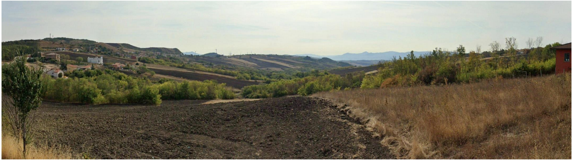
19 – SS303 Via XXIII Luglio – (Area Urbana di Bisaccia Nuova) verso Sud/Est