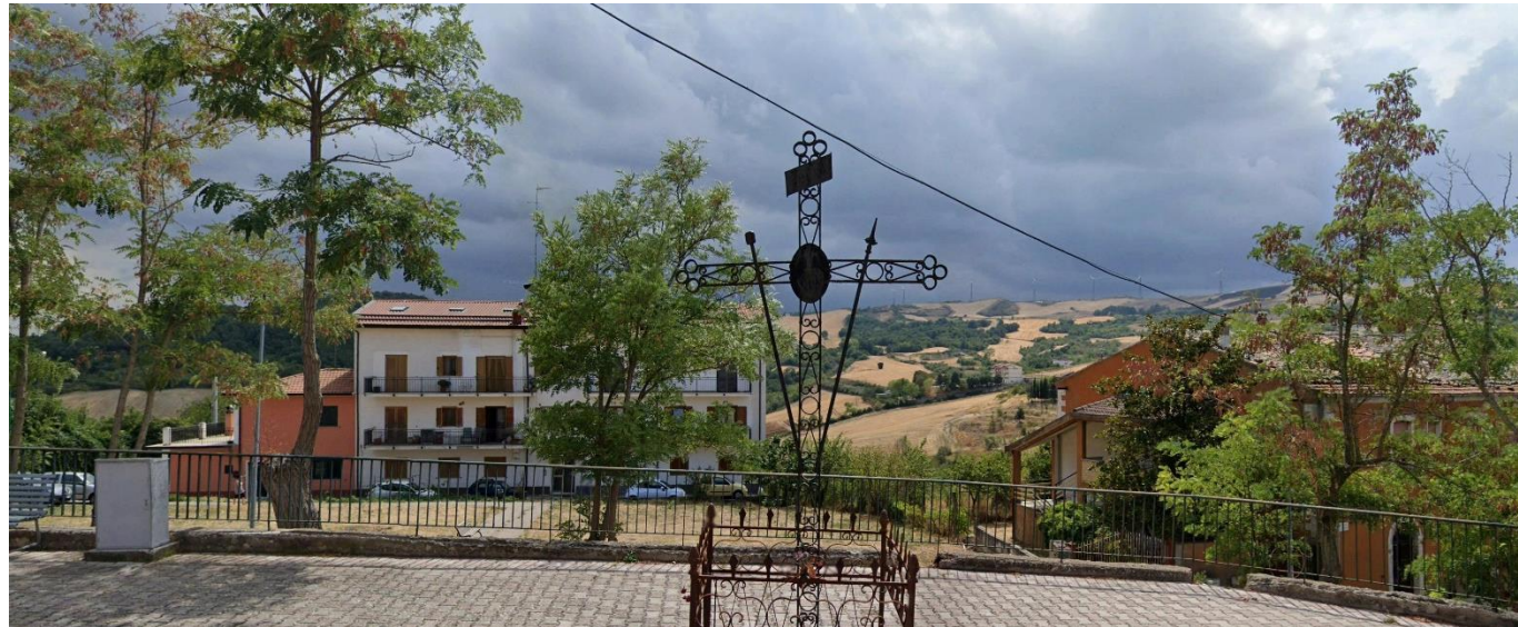
26 – Corso Augustale SS303 (Area Urbana di Lacedonia) verso Sud