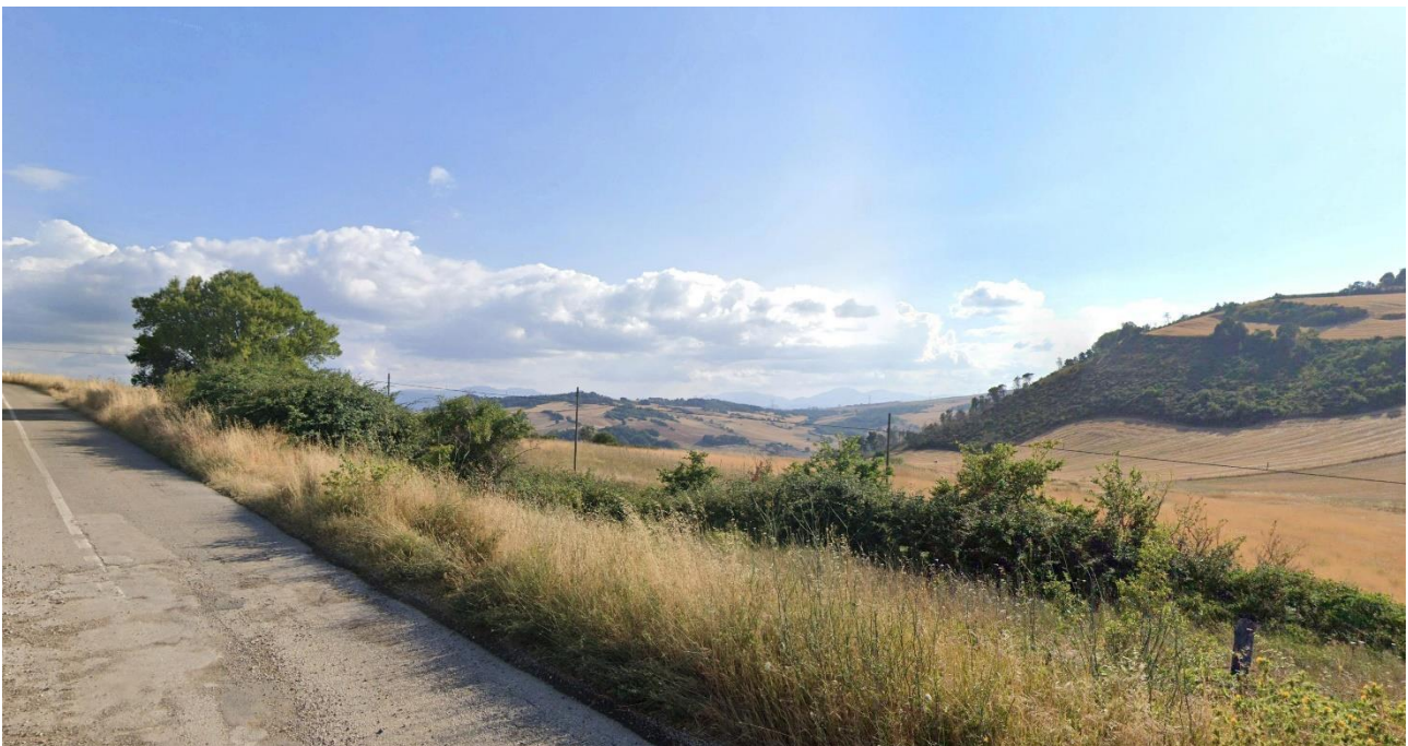
02 - Vista dalla SC Piano della Staccia verso Ovest