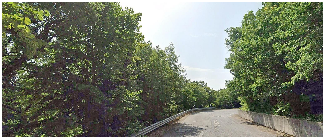
29 – SS91 C.da Margine verso Sud/Est