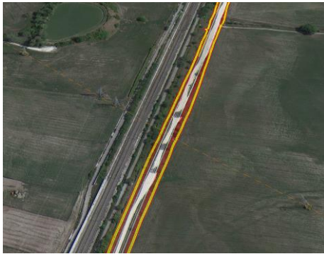
Interferenza con NVP1