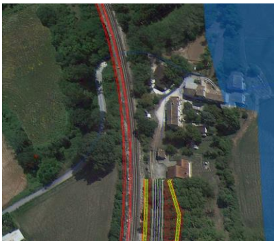
Progressiva linea nuova 1+214

Localizzazione: Linea ferroviaria su nuovo tracciato e nuova viabilità