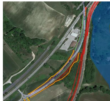
Interferenza con NV02