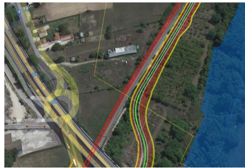
Interferenza con NV01

Note e caratteristiche servizio: Attraversamento inferiore da parte della linea gas