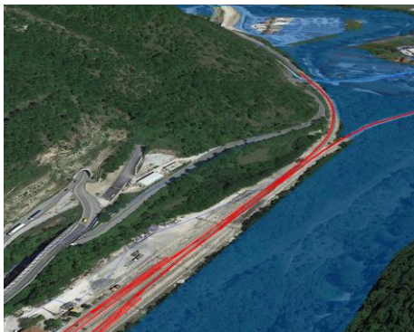
Progressiva linea nuova 3+968

Localizzazione: Linea ferroviaria su nuovo tracciato