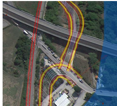
Interferenza con NVP1

Note e caratteristiche servizio: Attraversamento interrato da parte delle fognature