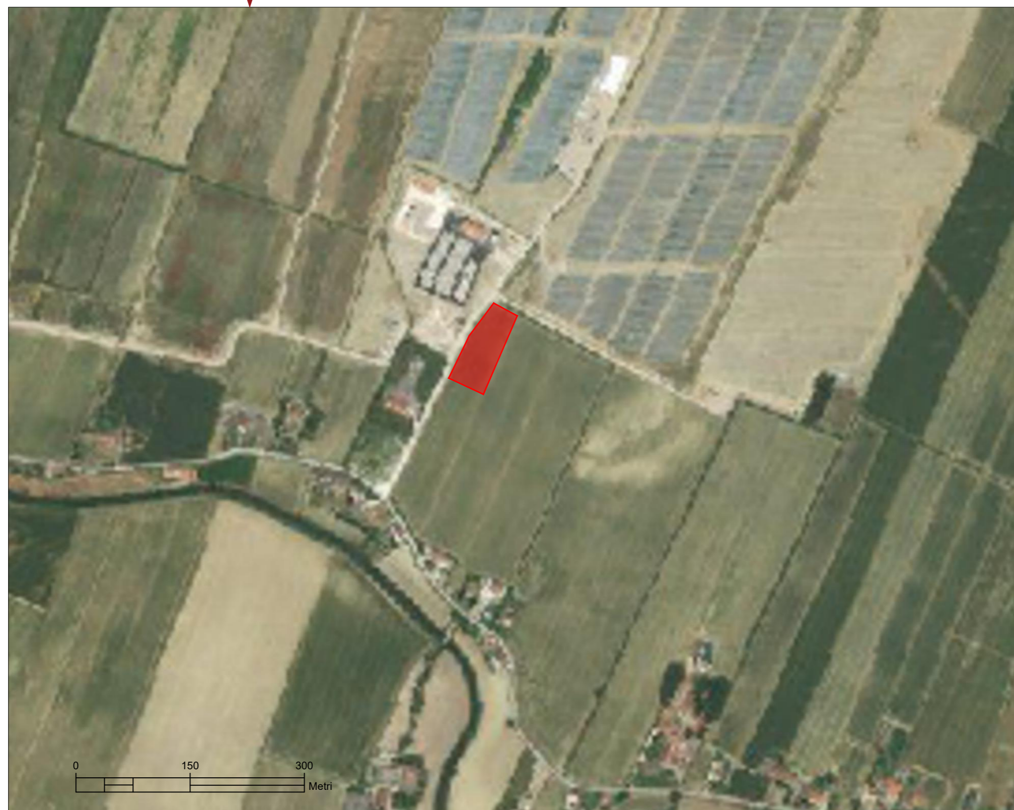
INQUADRAMENTO IMPIANTO - RETE NATURA 2000