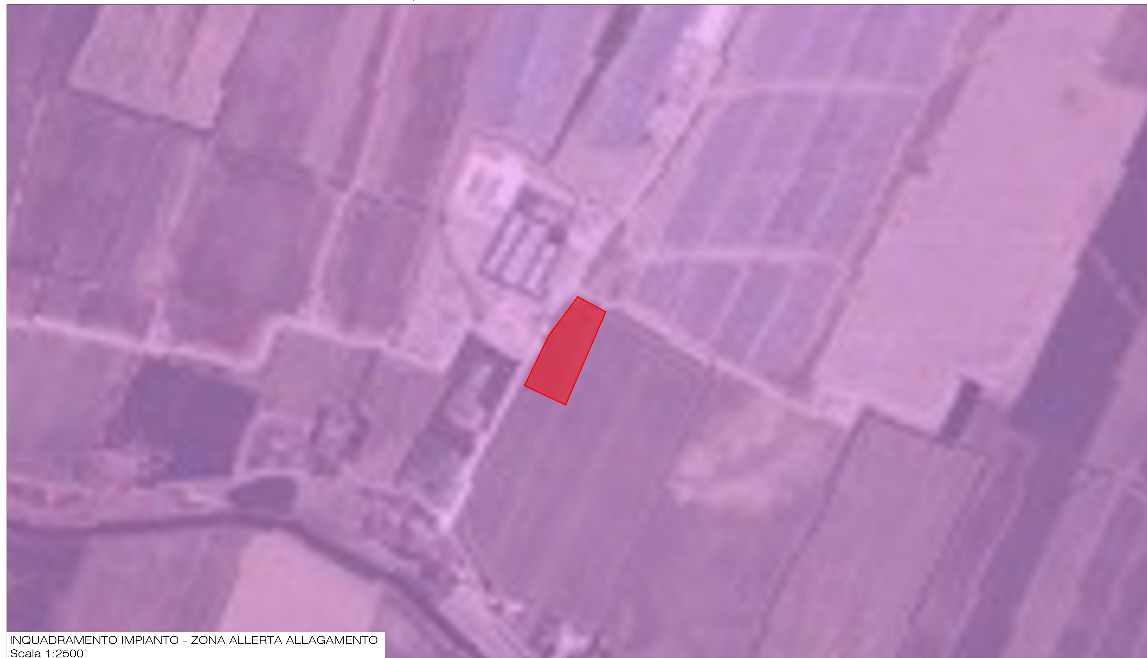
INQUADRAMENTO IMPIANTO - ZONA ALLERTA ALLAGAMENTO Scala 1:2500