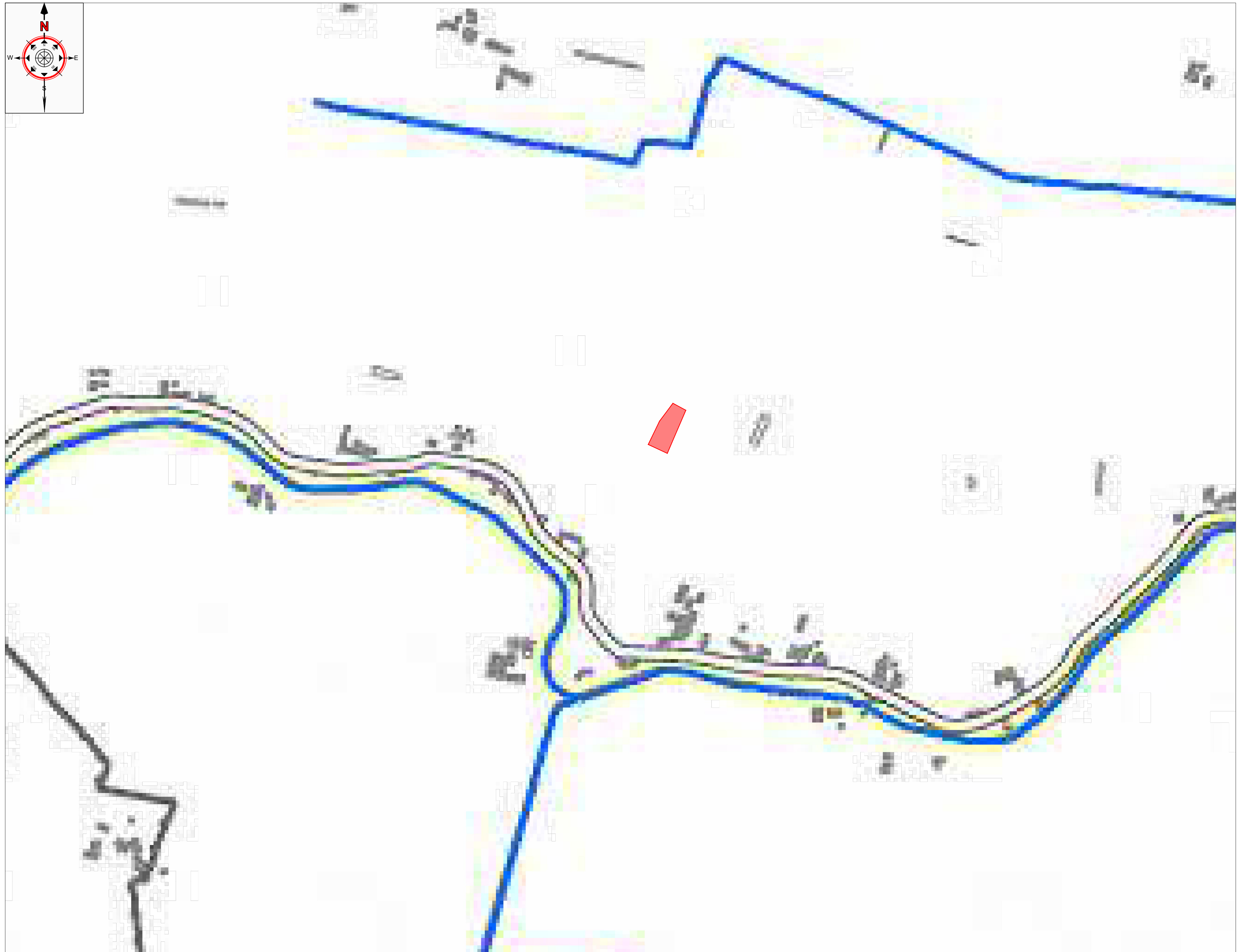
PTCP Carta dei vincoli e pianificazione territoriale Scala 1:5.000