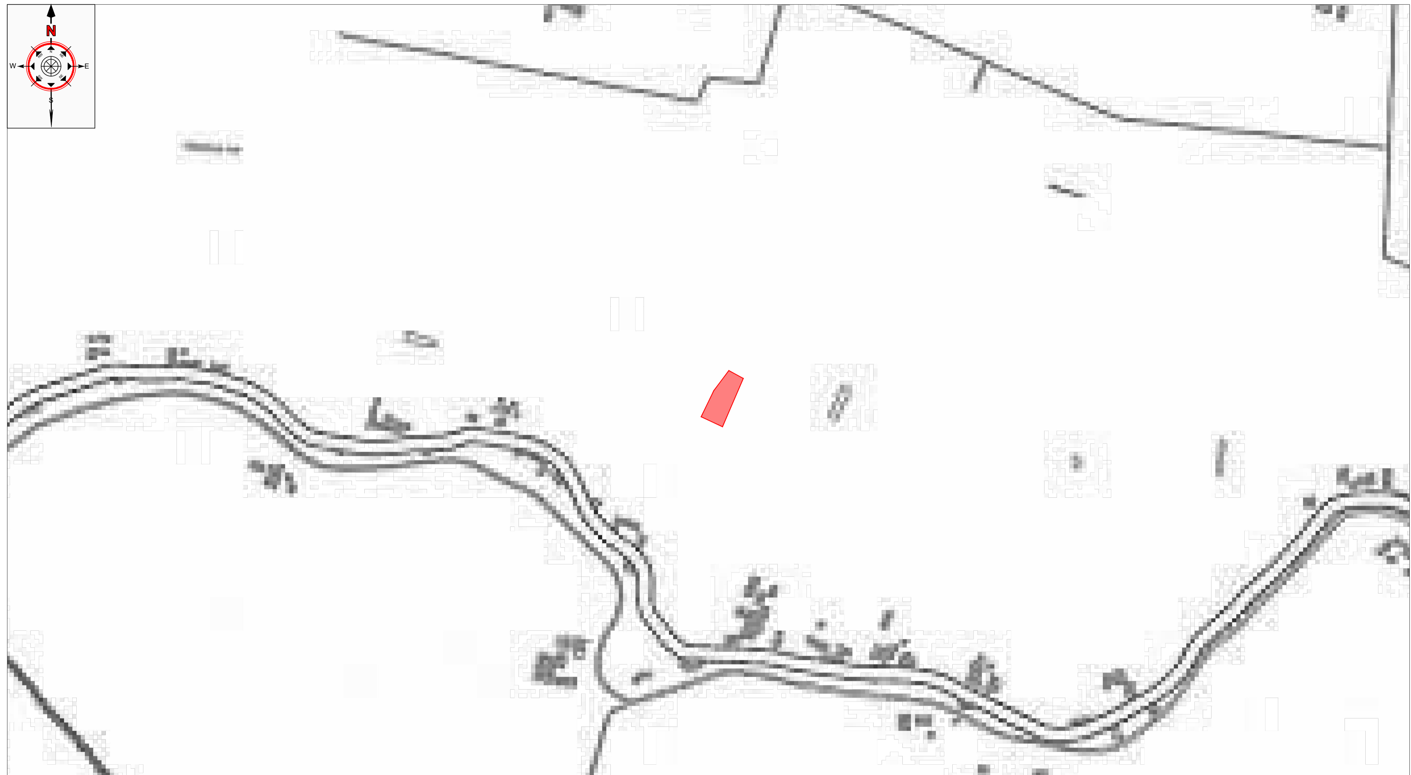
PTCP Carta sistema del paesaggio Scala 1:5.000