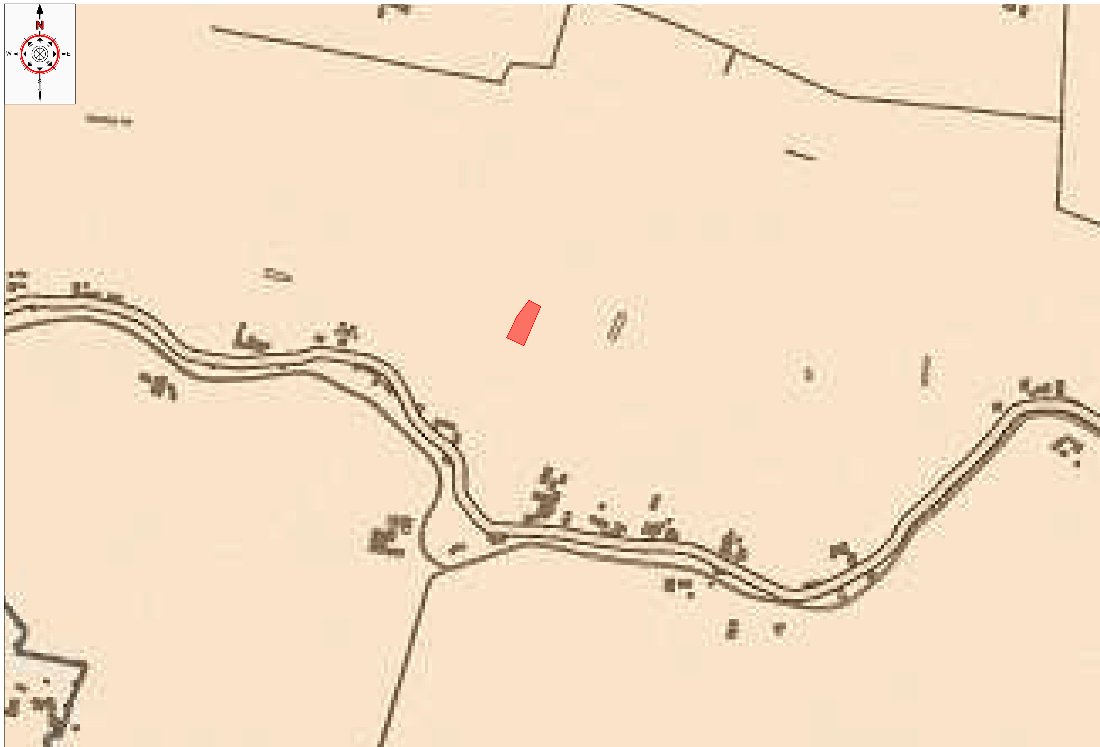
PTCP Carta tutele agronomiche ambientali Scala 1:5.000