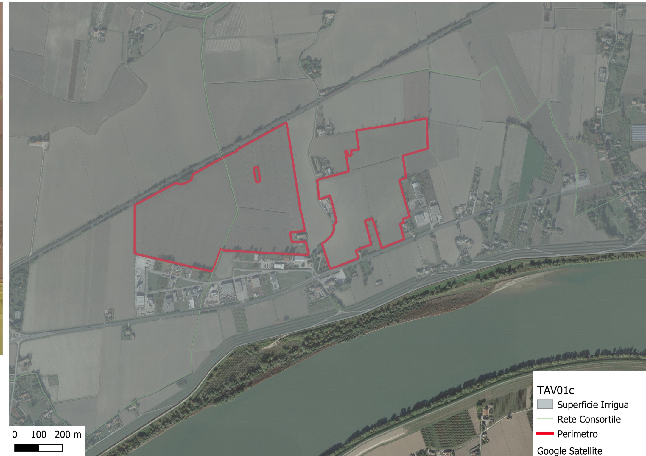
PTRC - TAV01c - USO DEL SUOLO_IDROGEOLOGIA