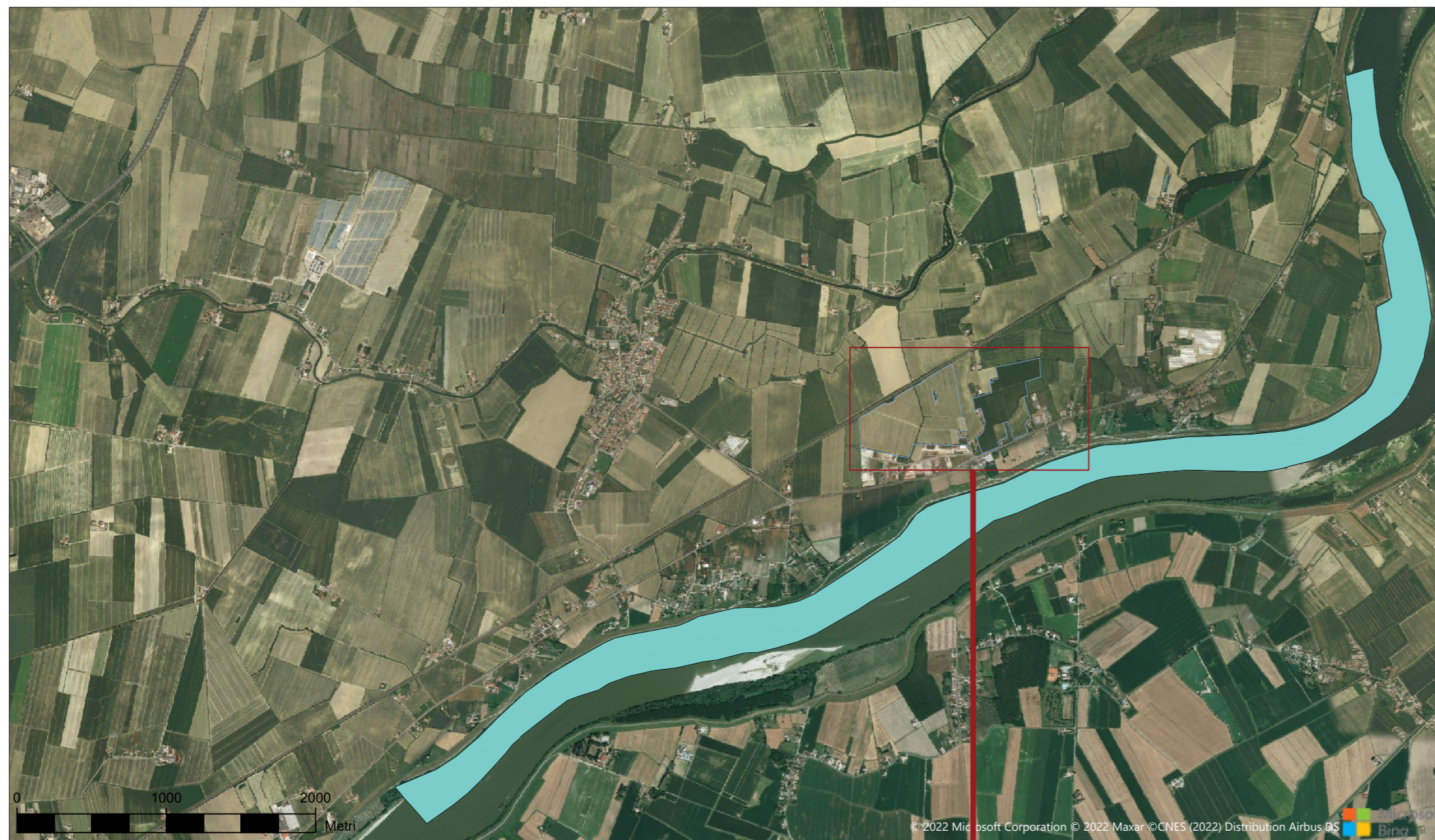
INQUADRAMENTO COMUNALE - RETE NATURA 2000