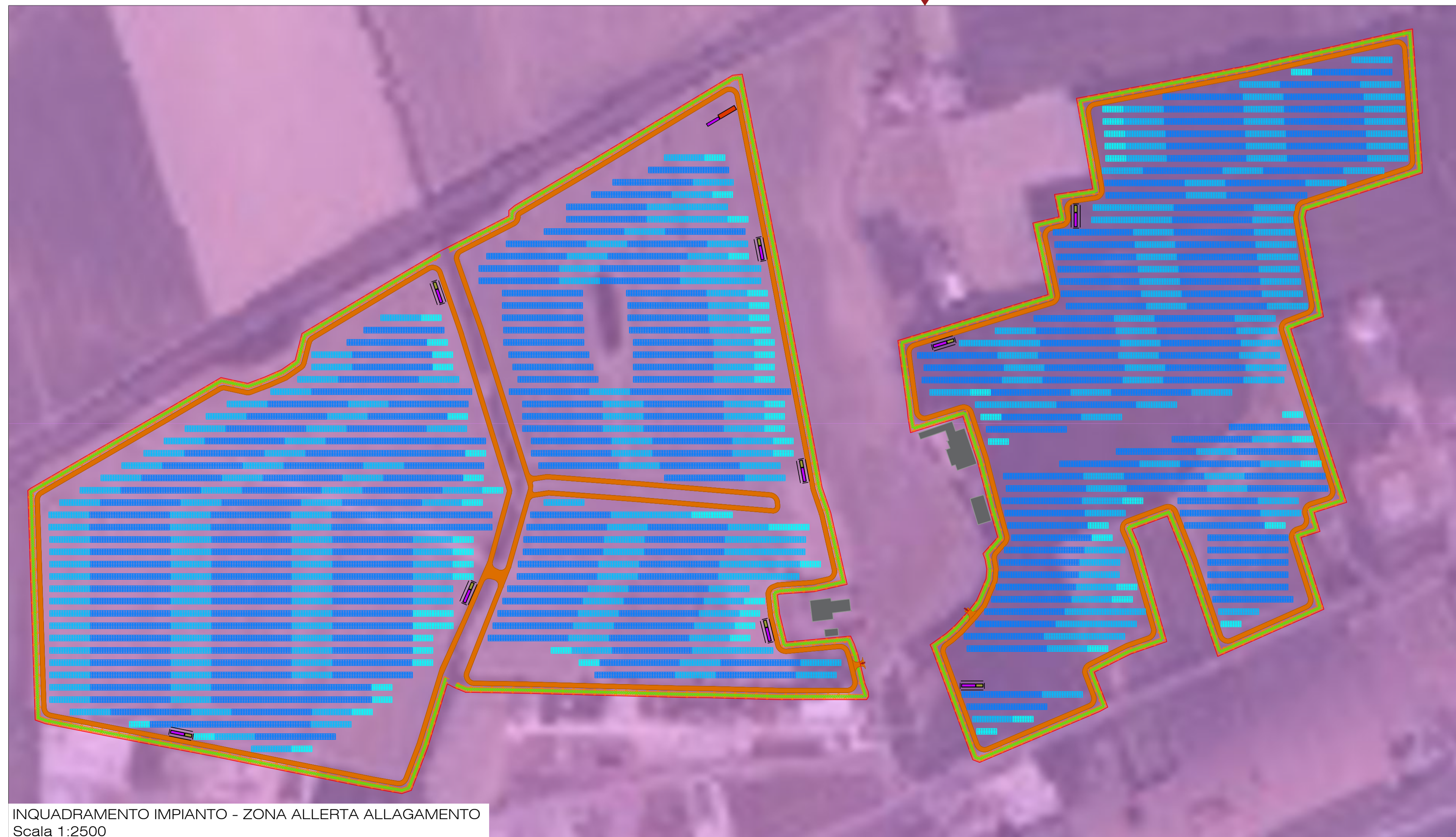
INQUADRAMENTO IMPIANTO - ZONA ALLERTA ALLAGAMENTO Scala 1:2500