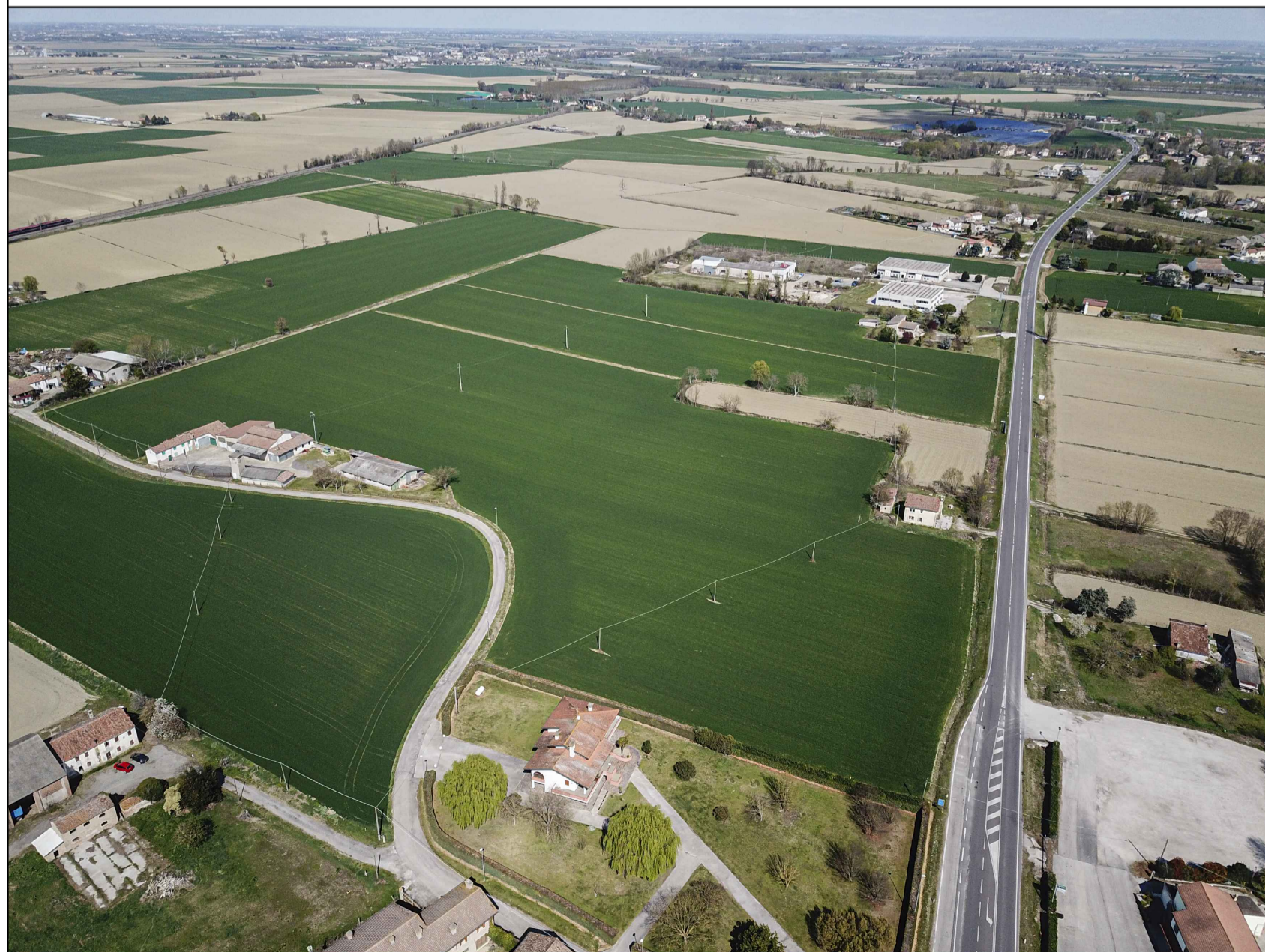
Foto 4 - Canaro 2 - Drone