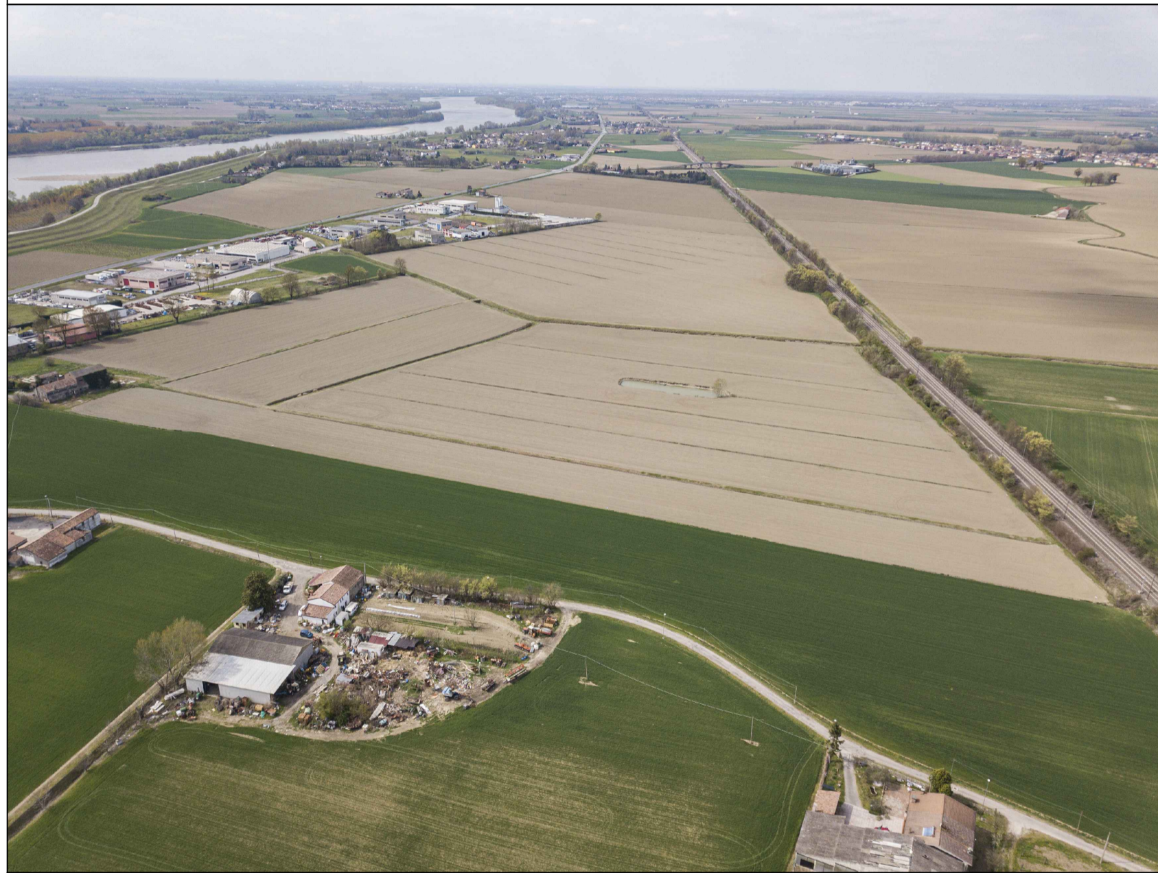
Foto 3 - Canaro 2 - Drone