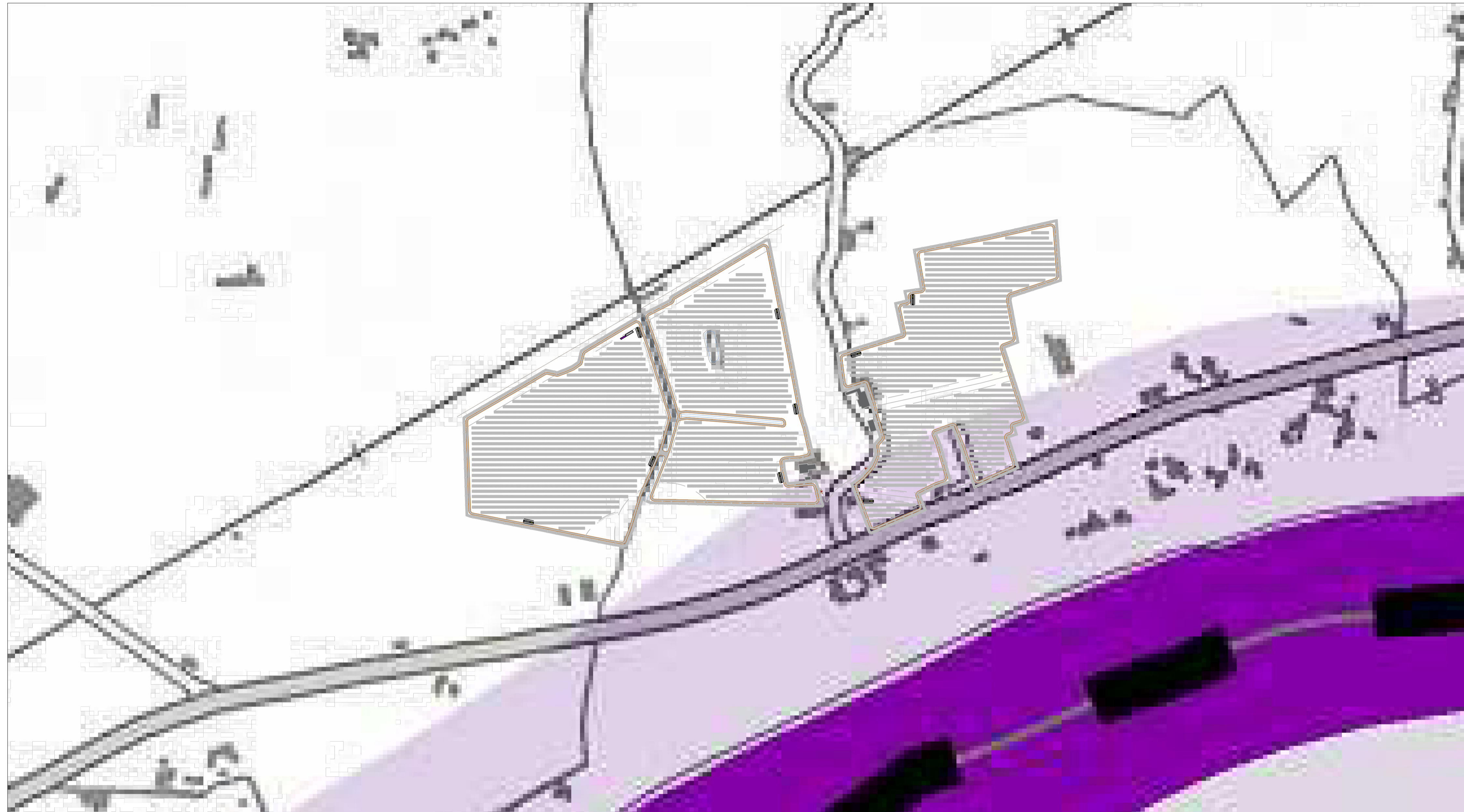
PTCP Carta sistema del paesaggio Scala 1:5.000