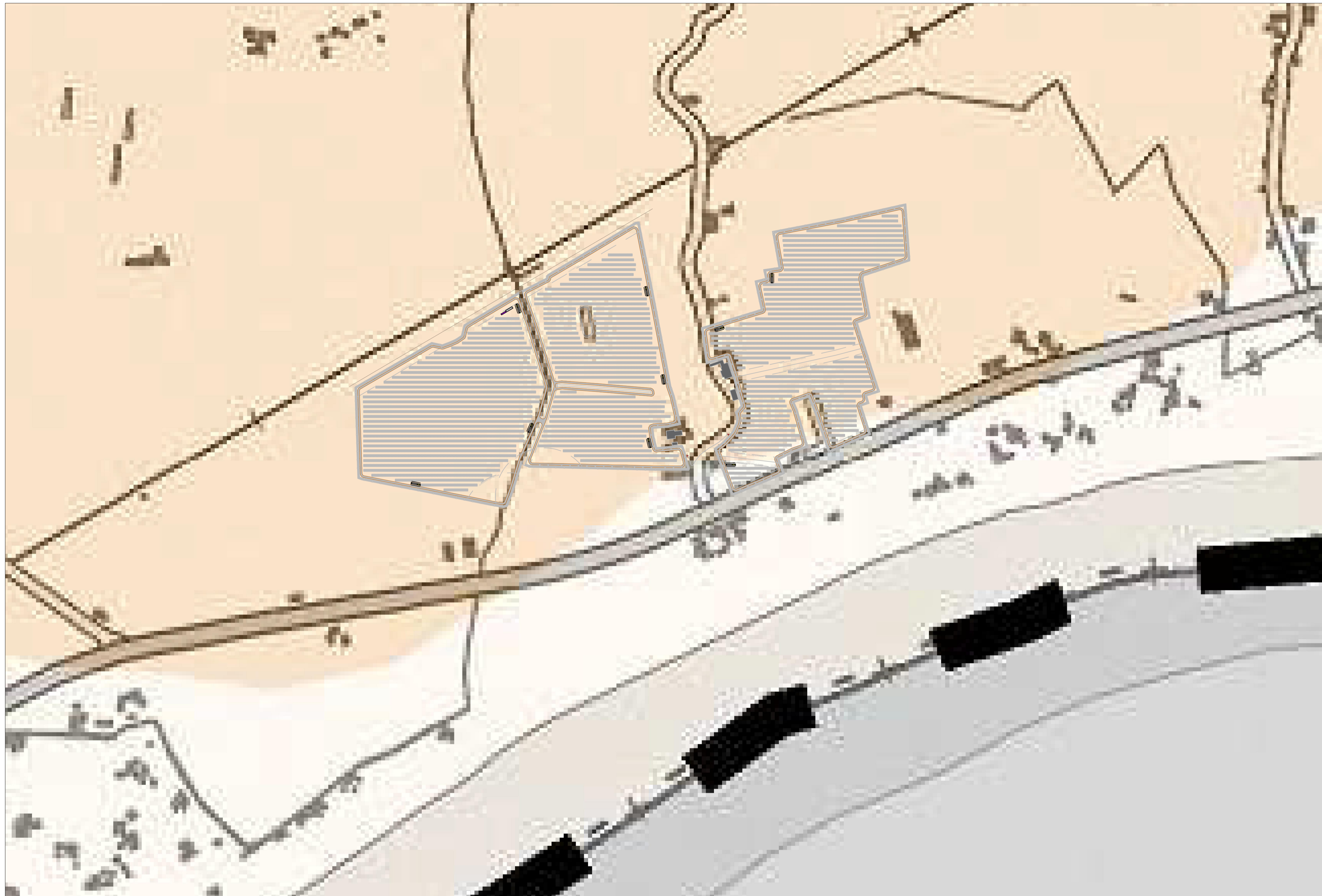
PTCP Carta tutele agronomiche ambientali Scala 1:5.000