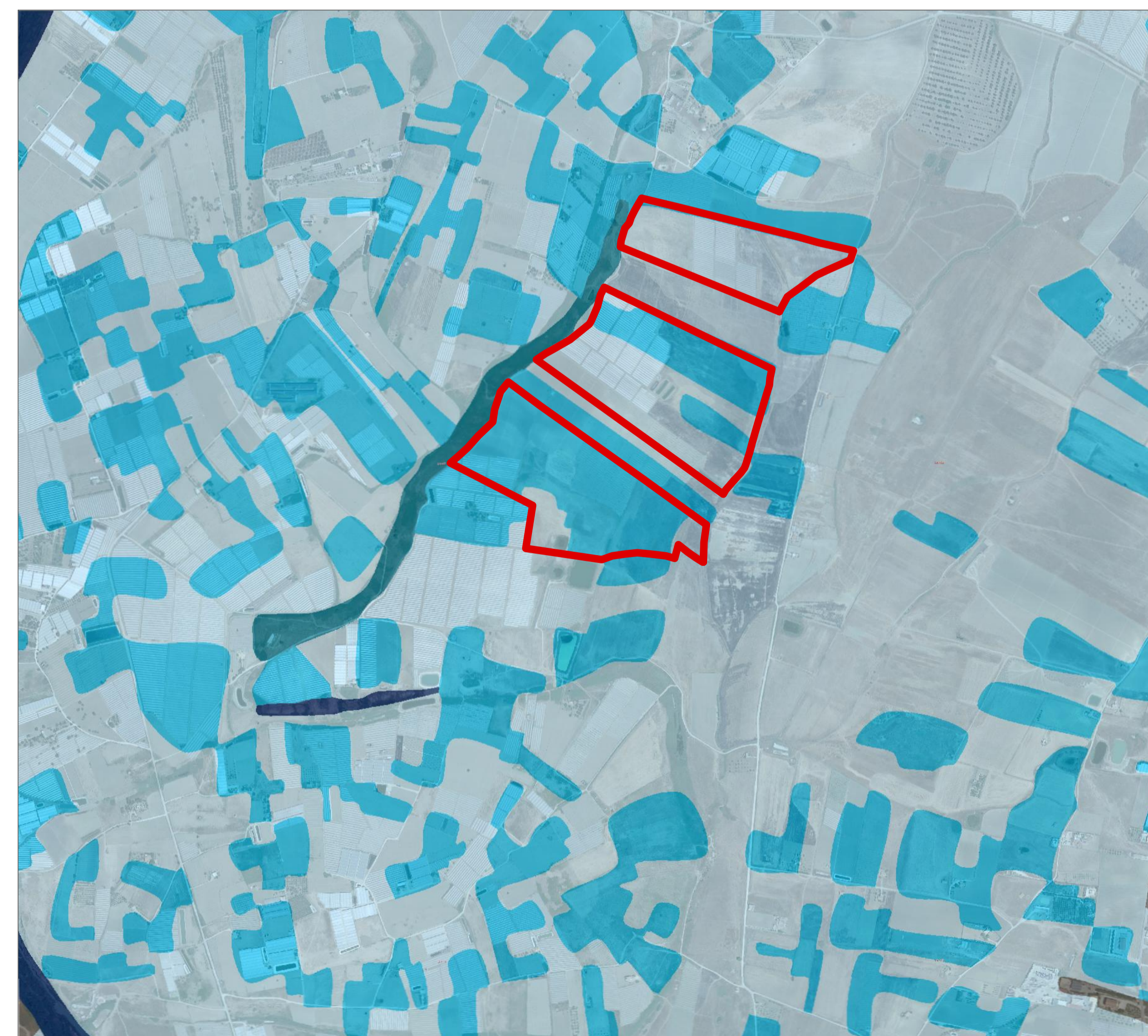
Inquadramento su Carta Sensibilità Ecologica/ 1:10.000