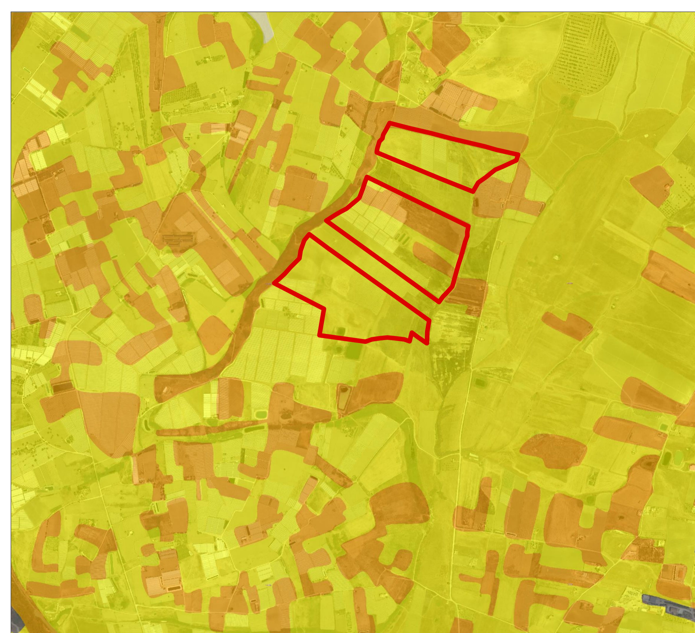
Inquadramento su Carta Fragilità Ambientale/ Fonte: S.I.T.R. (Geoportale Regione Sicilia - Infrastruttura dati territoriali) / 1:10.000